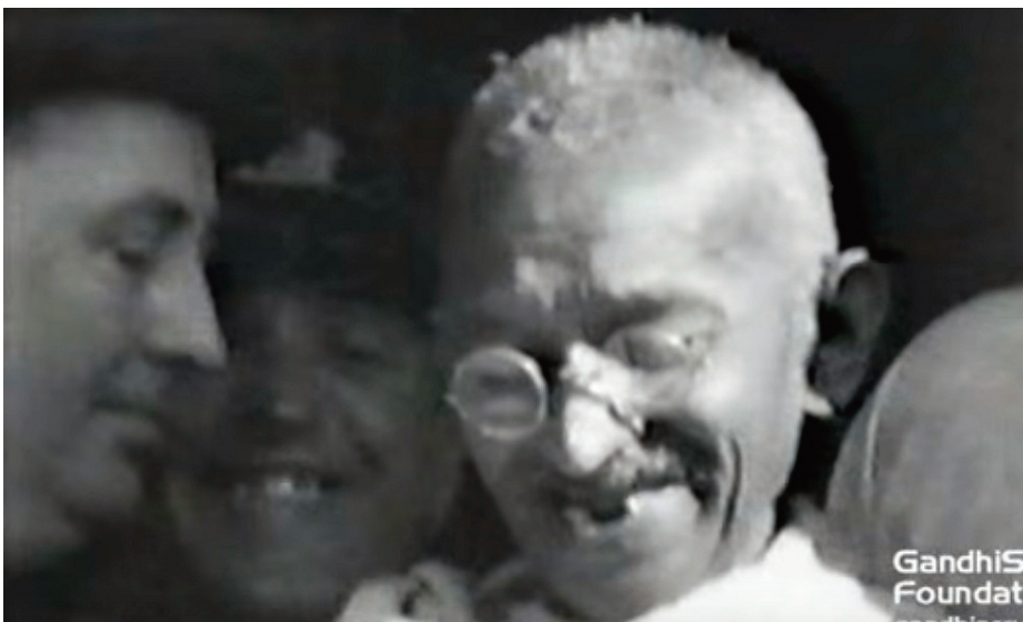
Gandhi a Brindisi sul piroscafo Pilsna