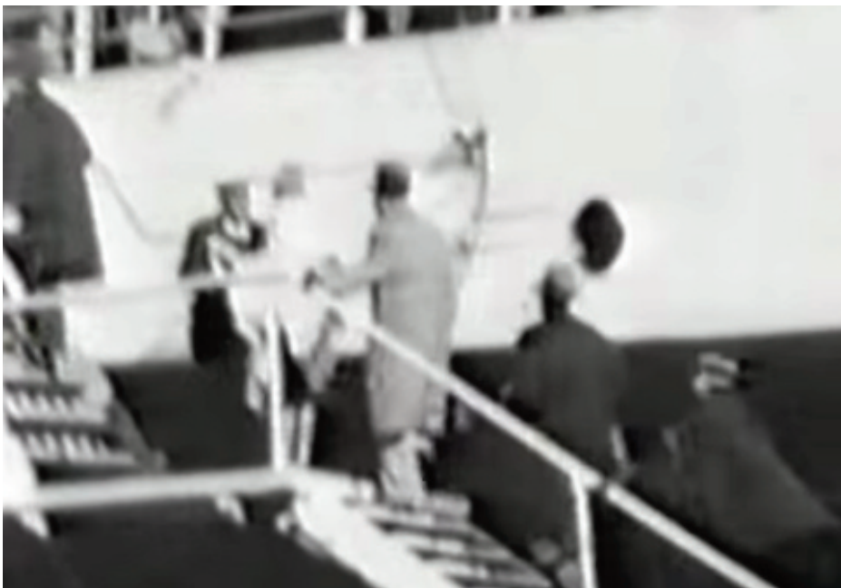
Gandhi sale sul piroscalo e al centro la celebre (e unica) foto di Gandhi a Brindisi

risalente all'epoca romana. Il canonico brindisino porse al Mahatma l'antico vaso che fu utilizzato per raccogliere e quindi bere il latte appena munto della capra che lo seguiva in ogni suo viaggio, Gandhi infatti era fautore di una vita semplice, viveva coerentemente i propri principi di sobrietà e dignitosa povertà pertanto si nutriva esclusivamente di verdure crude o bollite e di frutta, principalmente datteri, arance e uva, e solo per i sopraggiunti motivi di salute aveva accettato di bere il latte di capra, "è stata la tragedia della mia vita" così definì la scelta in una autobiografia dopo che aveva fatto del non bere latte un caposaldo della propria esistenza.