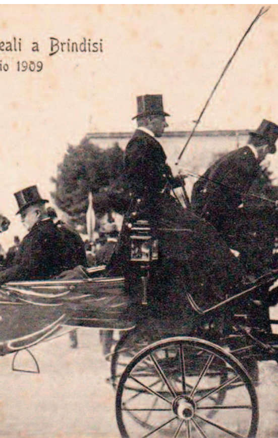
Sopra e accanto l'arrivo dei reali a Brindisi, in alto a destra la corazzata Vittorio Emanuele, in basso la regina Elena e il re Vittorio Emanuele, nella pagina accanto l'imperatore Guglielmo II di Germania e il re Vittorio Emanuele a cavallo