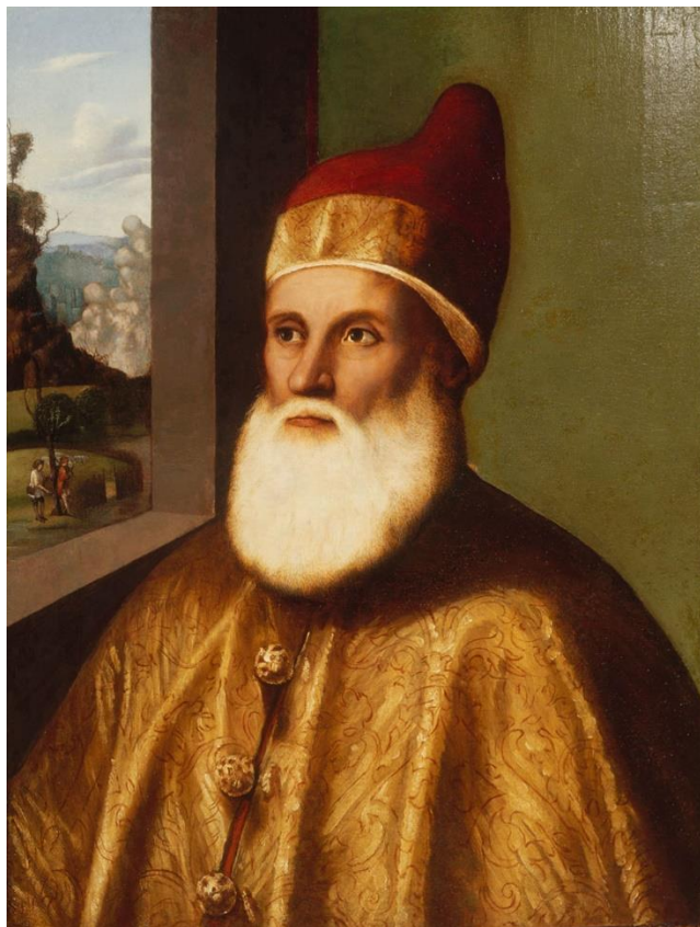
Il Doge veneziano Agostino Barbarigo

Così, dunque, nel 1496 Brindisi fu, non conquistata, ma in qualche modo comprata – di fatto ricevuta in pegno – da Venezia, e i veneziani la governarono per tredici anni, fino al 1509, quando passò ad integrare il vicereame spagnolo di Napoli, senza che comunque Venezia abbandonasse da subito l'idea di una eventuale riconquista, aspirazione certamente ancora viva perlomeno fino a quell'ultimo infruttuoso tentativo concreto effettuato durante la cosiddetta "Campagna di Puglia di Lautrec" del 1528 e 1529. Poi, finalmente, cessarono le secolari aspirazioni veneziane di conquista su Brindisi e scemarono le dispute militari tra le due città, senza che comunque cessassero le relazioni commerciali destinate, invece, a perdurare tra alti e bassi molto a lungo: di fatto, inevitabilmente, per sempre.