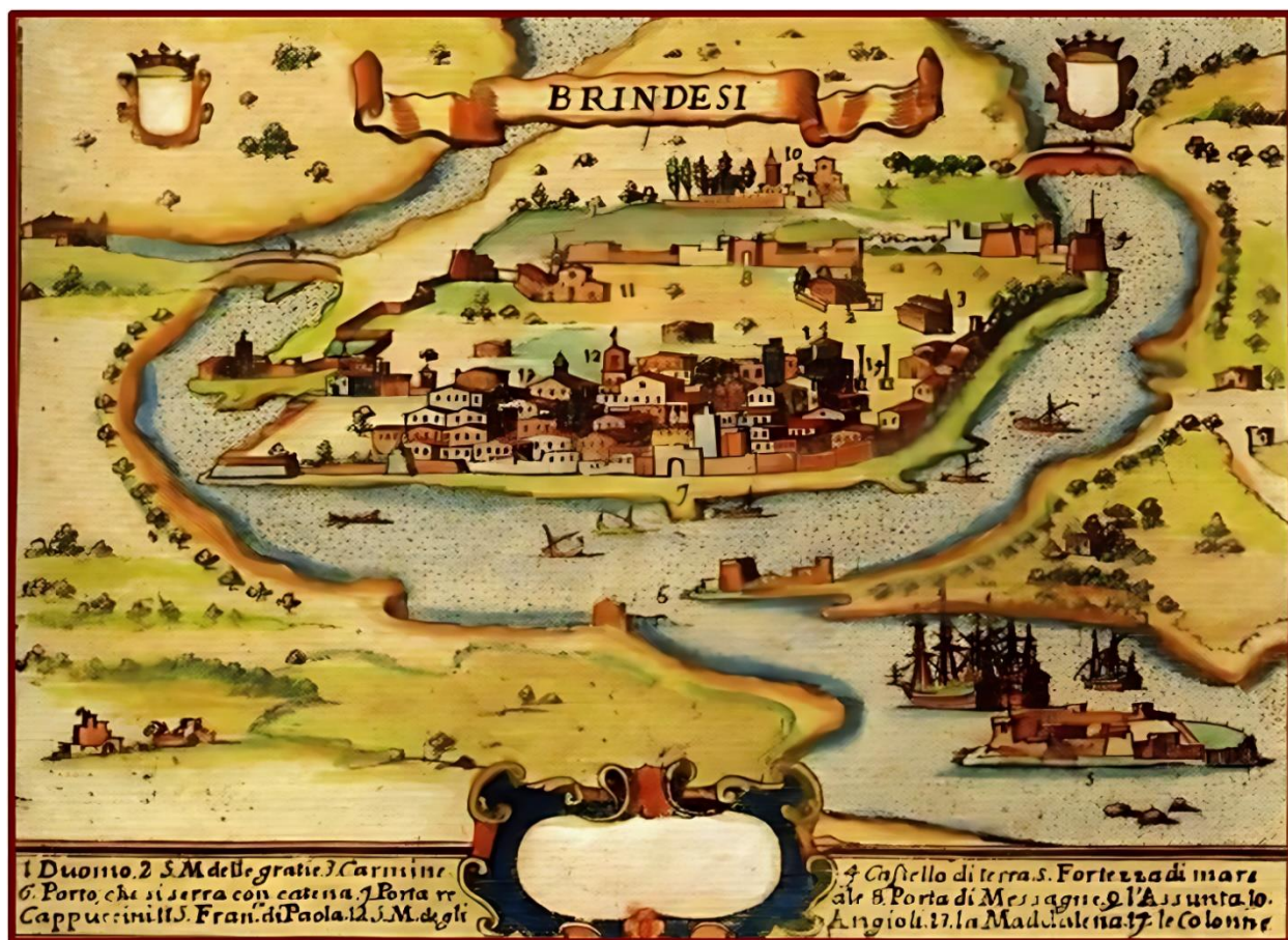
Brindisi del '400 - di autore ignoto - Versione colorata di quella pubblicata da Pacichelli nel 1703