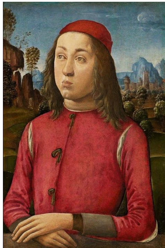
Ferdinando II d'Aragona detto Ferrandino