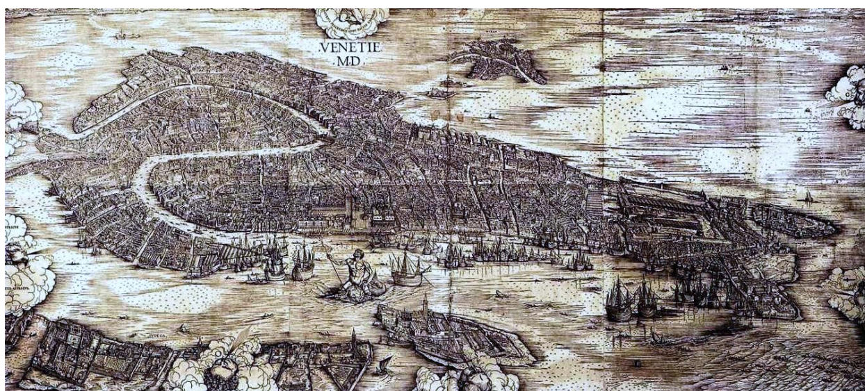
Venezia nel 1500 - di Jacopo de' Barbari