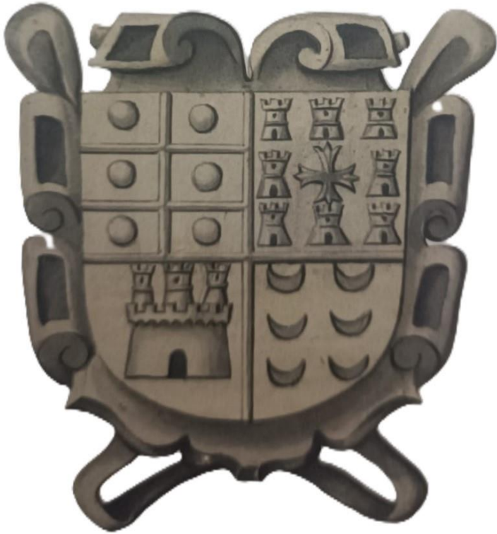
Brindisi. Isola di Sant'Andrea. Castello. Stemma di Lorenzo Carrillo del Melo (da Araldica della città di Brindisi nelle memorie di Giovanni Leanza, a cura di GIUSEPPE MADDALENA CAPIFERRO, Brindisi: Soroptimist International d'Italia-Club di Brindisi, 2005).

Il castello di terra non versa in condizioni migliori; ha appena quattordici soldati sui trenta necessari. L'arcivescovo chiede, a evitare ogni inconveniente, che stanzino in Brindisi due compagnie di fanteria.