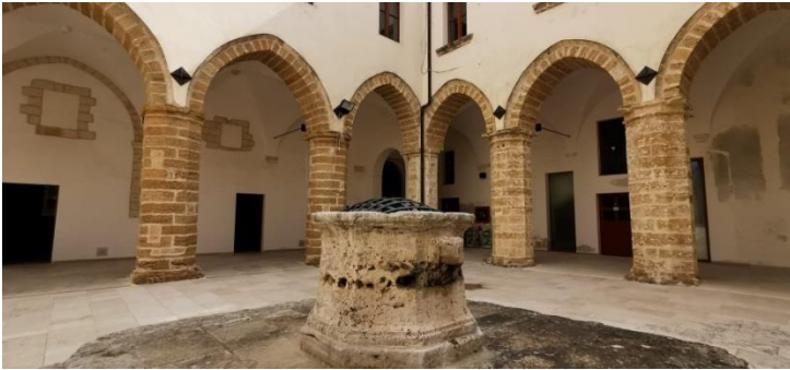
Brindisi. Complesso di San Paolo Eremita. Chiostro.

La situazione non è migliore sul versante dello spirituale; ai bisogni dell'anima provvedono, oltre ai canonici della Metropolitana, cinque « monasterios de frailes », tutti ospizio di « ignorantes »; è necessario, allora, che si provveda all'istituzione di un collegio di Gesuiti.