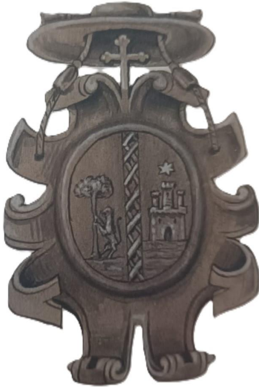
Brindisi. Cattedrale. Coro dei Canonici. Stemma di Andrés de Ajardi.

Peraltro, l'eventualità di un assalto ottomano pur sempre incombente perchè «la Belona [Valona] està a sesenta millas que espasasse de galeras de una noche, la Sclavonia, Albania y otras provincias. Esta ciudad no tiene muralla, que sea de