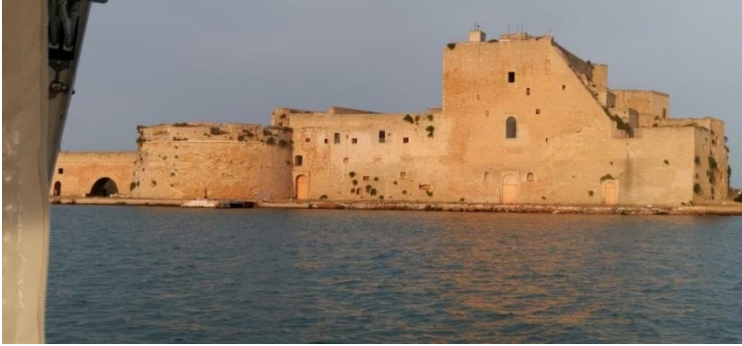
Brindisi. Isola di Sant'Andrea. Castello

quest'ufficio per avviare con tranquillità transazioni di dubbia legittimità.