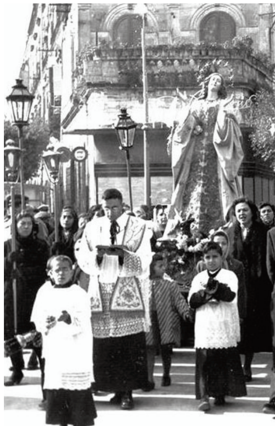
Sopra la processione della Madonna di San Paolo, a destra una ricostruzione della cattedrale romanica (dis. A.Mingolla), sotto la Madonna del Terremoto e a destra in basso l'epigrafe che ricorda l'evento

distanza dalla costa. Il maremoto, secondo gli studiosi, dovrebbe aver avuto minimo due onde con direzione da sud sud-est la cui altezza ha potuto raggiungere gli undici metri. Ulteriori ricerche sul litorale brindisino hanno permesso di individuare gli effetti di questo maremoto anche a Torre Santa Sabina, mentre a Brindisi sembra che vi fu un improvviso abbassamento del livello del mare del porto interno, infatti nella Cronaca dei Sindaci si legge: "è stato così spaventoso che ritirandosi il mare, faceansi vedere aperture della terra, ed il molo di Porta Reale diviso in tre parti". Secondo gli studi del prof. Sansò la quota