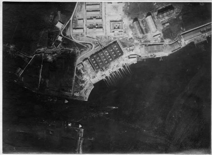
Brindisi. Stazione idrovolanti.

Quindi attaccare il nemico con il naviglio sottile e silurante, del quale l'Italia disponeva un maggior numero, preservando e mantenendo pronte le unità maggiori per uno scontro con le pari unità austro-ungariche.