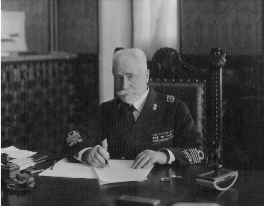
Il grande ammiraglio Paolo Thaon di Revel

Una delle prime azioni di Revel fu quella di prodigarsi affinché non si procedesse alla costruzione già programmata di costosissime unità, facilmente affondabili da mina o da siluro. Il costo avrebbe assorbito l'annuale assegnazione destinata al rinnovo del naviglio, non consentendo così la costruzione di nuove siluranti e sommergibili. Revel, infatti, intuì in anticipo le potenzialità e la pericolosità del mezzo subacqueo.