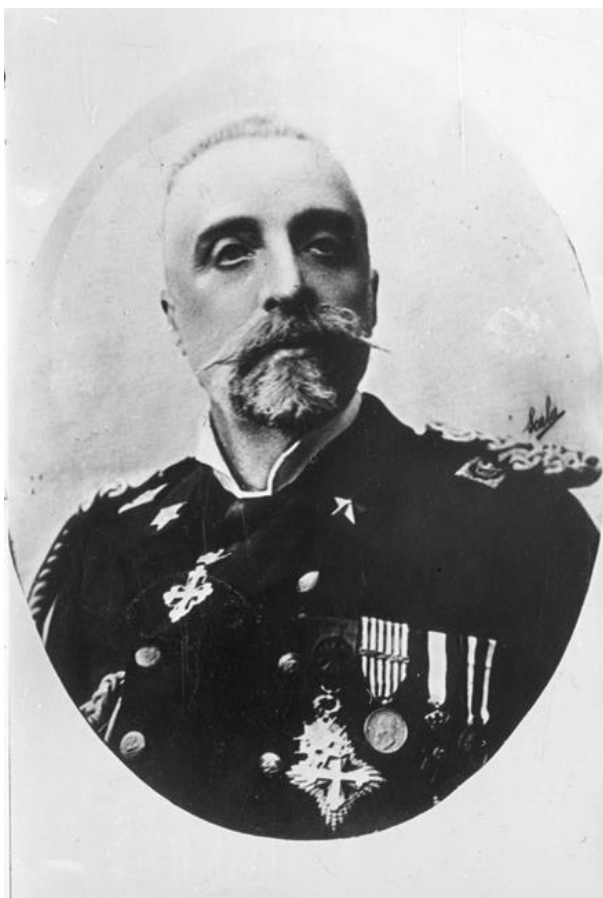
L'ammiraglio Giovanni Bettolo

Nel 1907 e precisamente il 1 aprile, fu nominato il nuovo capo di Stato Maggiore della Marina, l'ammiraglio Giovanni Bettolo. Di famiglia emigrata dal Trentino, il Bettolo era stato educato con spirito risorgimentale, era stato decorato di medaglia al Valor Militare alla battaglia di Lissa, e non era certo un fautore dell'amicizia con l'Austria.