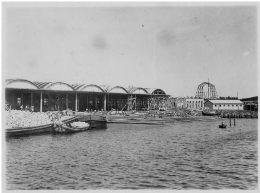
Hangar per idrovolanti in costruzione sulla sponda settentrionale del porto medio di Brindisi

sulla dislocazione e sui movimenti del nemico, per operazioni offensive diurne e notturne e per azioni di contrasto.