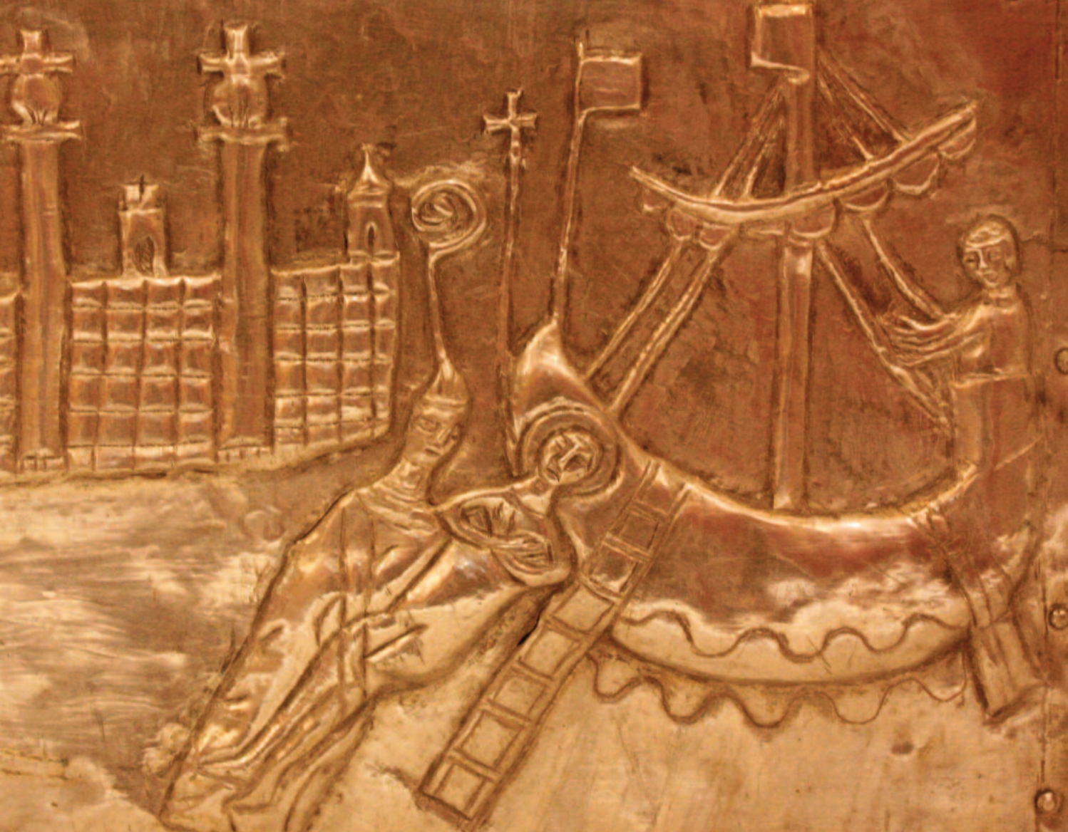
LE IMMAGINI Nella foto in alto l'Arca di san Teodoro, particolare della traslazione delle spoglie a Brindisi, sotto il Papa in preghiera dinanzi alle spoglie di san Teodoro. Nella pagina accanto la Festa di San Teodoro nel 1937

persino ad incendiare il tempio di Cibele (la gran madre degli dèi), all'epoca al centro alla città. Rinchiuso ancora in carcere venne confortato da "celesti apparizioni", fu poi torturato e condannato alla morte per fame, da cui sarebbe miracolosamente