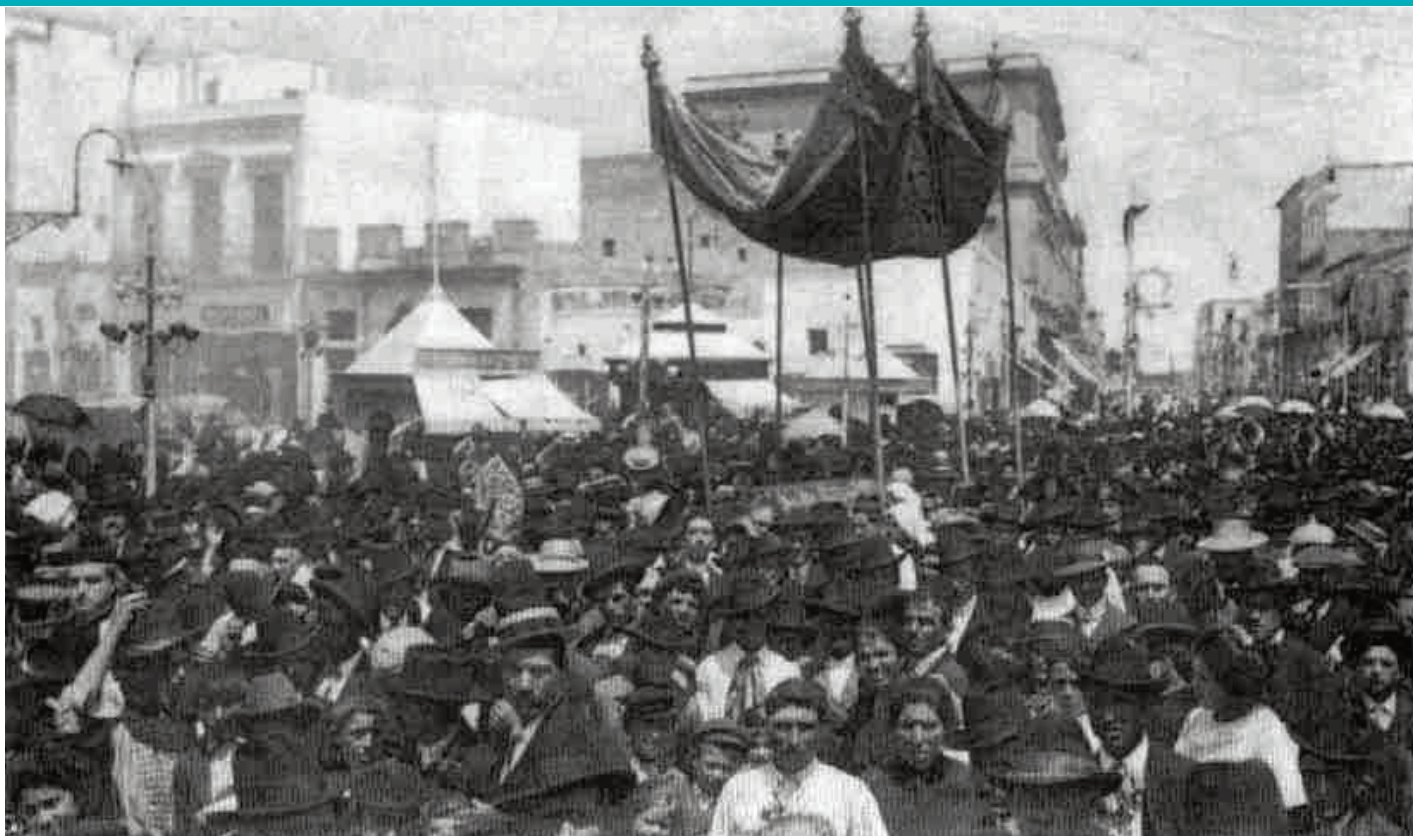
LE IMMAGINI Sopra un'antica processione in onore di San Teodoro, in basso il vecchio tosello

Le reliquie furono custodite sino al 1899 in un'arca di cipresso completamente rivestita con lastre d'argento realizzate nella prima metà del XIII secolo, su una di esse è incisa, con rilievi a sbalzo, la scena dello sbarco e dell'accoglienza da parte del vescovo, che preleva da una imbarcazione il corpo di un santo aureolato, a braccia incrociate sul petto, per condurlo nella città murata difesa da torri, dove si distinguono bene le due colonne del porto. "L'insieme organico di questi motivi iconografici, riscontrabile anche nelle immagini che documentano l'arrivo delle spoglie di san Nicola a Bari - scrive Teodoro De Giorgio nel suo interessantissimo volume sulla storia e il culto del soldato martire - aveva la chiara funzione di certificare l'avvenuta traslazione e di legittimare il possesso delle reliquie da parte della sede che le aveva solennemente accolte".