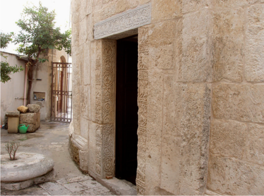
Fig. 14. Brindisi, Tempio di San Giovanni al Sepolcro, esterno con portale meridionale.