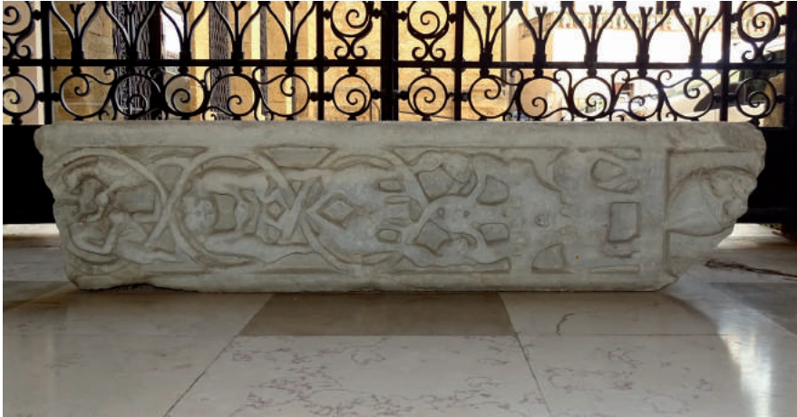
Fig. 4. Frammento di stipite, marmo. Brindisi, Museo archeologico “Francesco Ribezzo”.