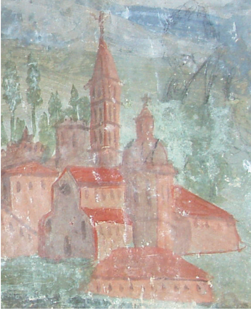
Fig. 2. Veduta della cattedrale romanica di Brindisi, particolare dell'affresco della controfacciata. Brindisi, Santa Maria del Romitorio.