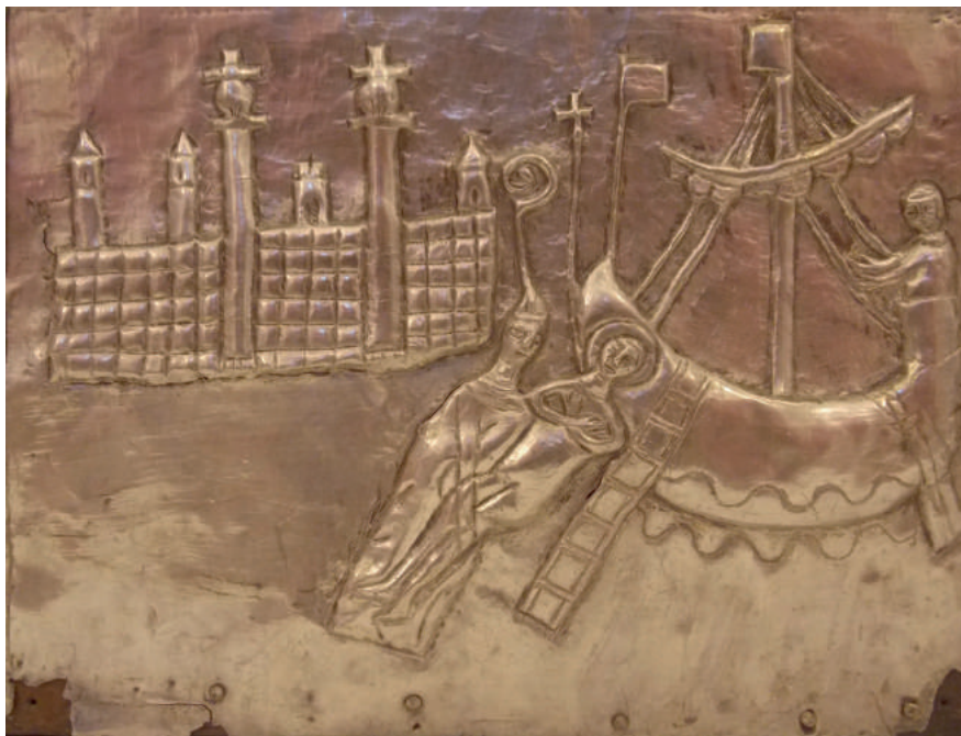
Fig. 1. Traslazione del corpo di san Teodoro a Brindisi, particolare dell'Arca di San Teodoro, seconda metà del sec. XIII (?). Brindisi, Museo Diocesano «Giovanni Tarantini».