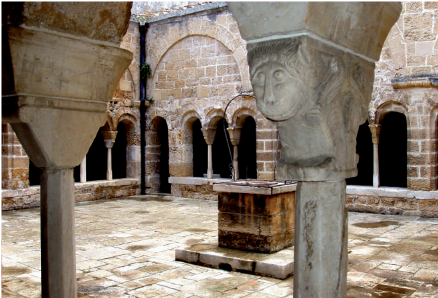
Fig. 11. Brindisi, chiesa di San Benedetto, chiostro (Foto dell'Autore).