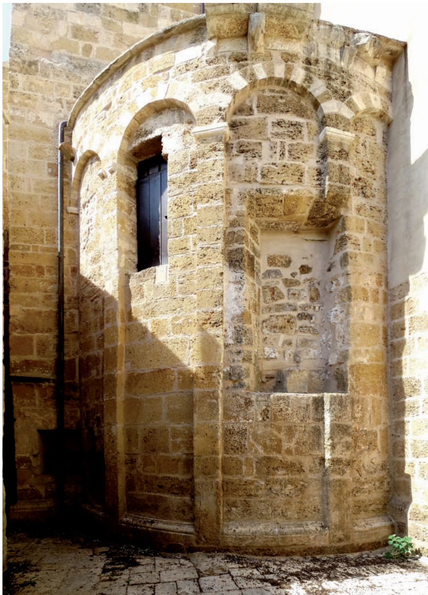
Fig. 6. Abside romanica destra. Brindisi, basilica cattedrale.