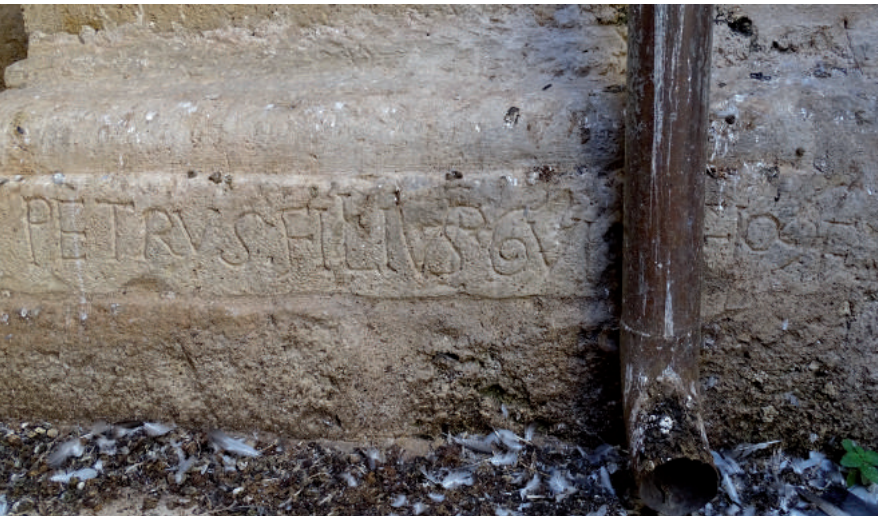
Fig. 8. Iscrizione, particolare dell'abside romanica destra. Brindisi, basilica cattedrale.