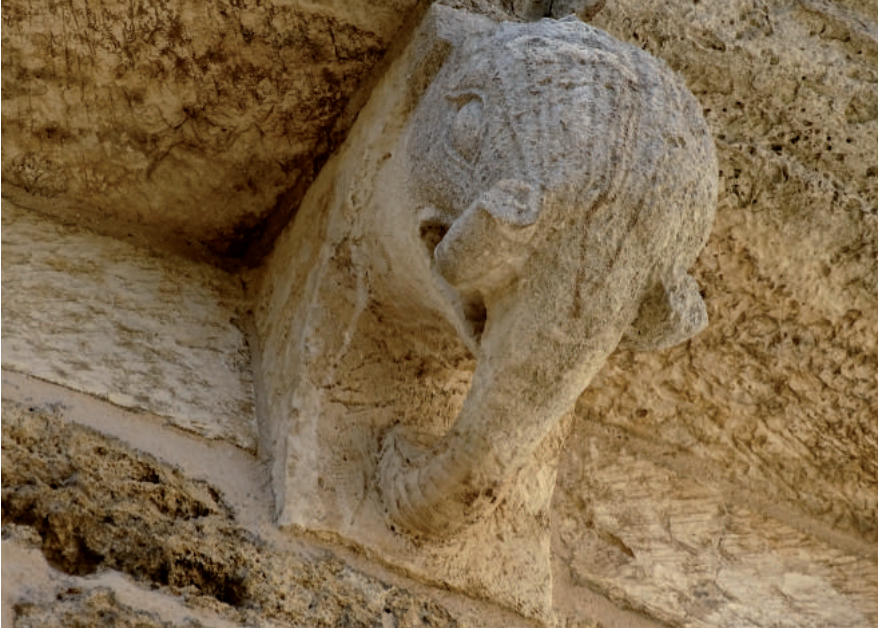
Fig. 7. Mensola con protome elefantina, particolare dell'abside romanica destra. Brindisi, basilica cattedrale.