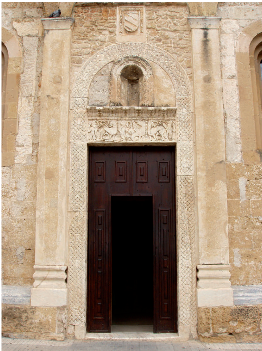
Fig. 9. Brindisi, chiesa di San Benedetto, portale meridionale (Foto dell'Autore).