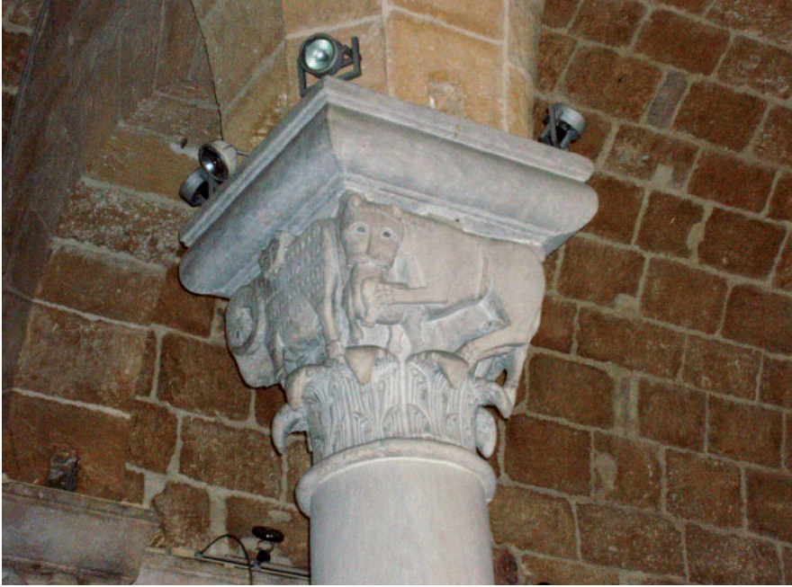
Fig. 10. Brindisi, chiesa di San Benedetto, interno, capitello figurato.