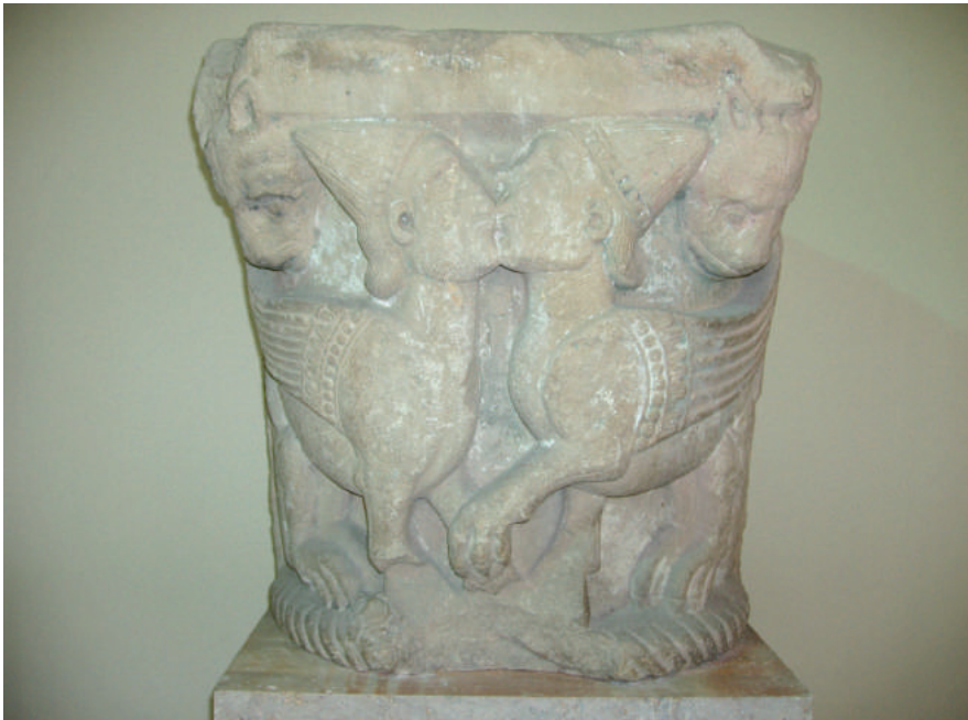
Fig. 5. Semicapitello con sfingi innamorate, marmo. Brindisi, Museo archeologico “Francesco Ribezzo”.