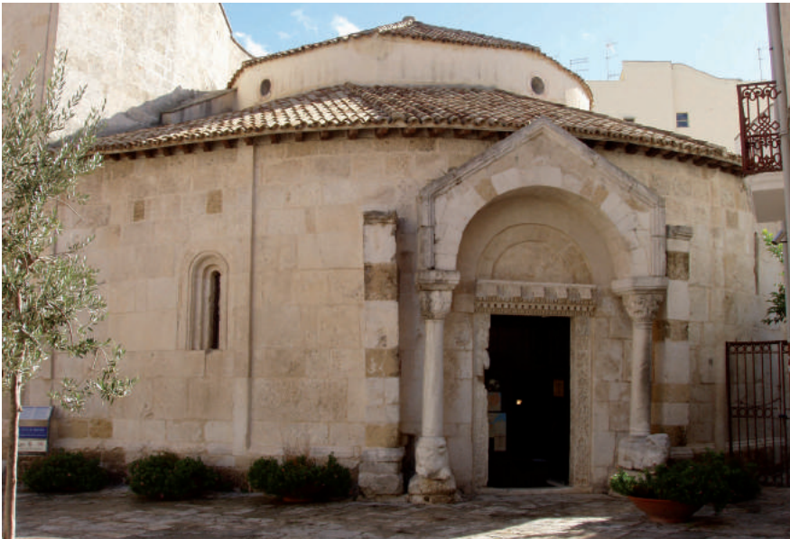
Fig. 13. Brindisi, Tempio di San Giovanni al Sepolcro, esterno con portale settentrionale.