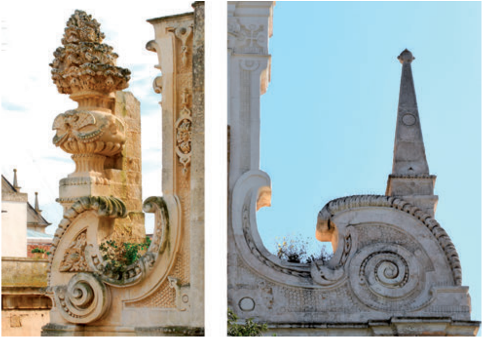
3. A sinistra una voluta di raccordo con trionfo di fiori presente nella facciata della chiesa di Santa Teresa a Lecce; a destra una voluta di raccordo del prospetto di Santa Teresa a Brindisi.

molizione e restauri di pezzi architettonici della Chiesa di S. Teresa”. Emerge in quegli anni la necessità urgente di riparare un cornicione del frontone della chiesa “ruinata dai fulmini” e che minacciava di cadere. Nel documento si legge che “il Municipio ha eseguito le opere reclamate dal primo bisogno, abbattendo i pezzi architettonici da demolire” e che bisognava ricostruire le parti abbattute “per non lasciare disarmonico e deformato il prospetto della Chiesa” 26 . Non si tratta dell’unico restauro eseguito negli anni bellici. La chiesa di Santa Teresa ricade in una zona tra le più colpite dai bombardamenti aerei durante la Seconda guerra mondiale. Leggendo la relazione dei lavori di riparazione del secondo dopoguerra, si evince che i danni maggiori furono