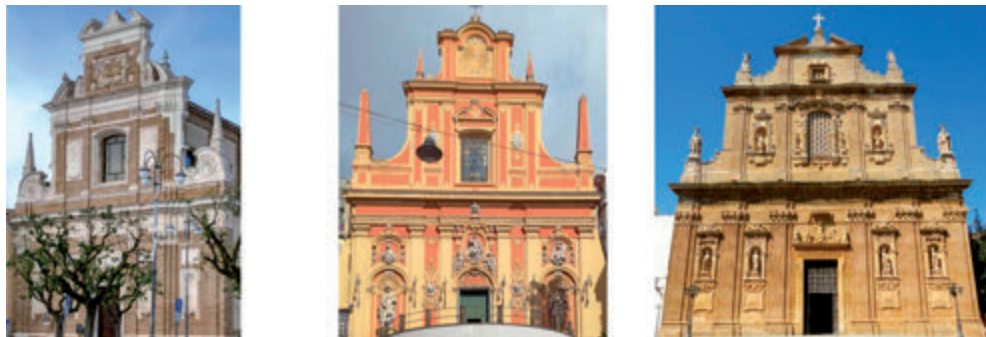
1. Facciate a confronto: Santa Teresa a Brindisi (a destra); Santa Teresa a Chiaia a Napoli (al centro); Crocifisso di Galatone (a sinistra)

po arricchisce il proprio repertorio con motivi decorativi napoletani, ispirati principalmente all'opera di Cosimo Fanzago.