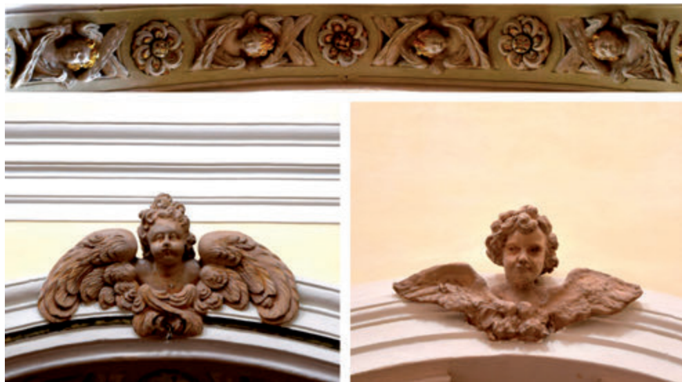
9. Tipologie di cherubini presenti fra navata e cappelle laterali

di un anno. La convenzione prevedeva opere quali “un’architavato sotto la cornice dell’intempiatura, et unirlo col friso del cornicione già fatto, et fare similmente tutti quelli capitelli, conforme ricerca il disegno e l’ordine dell’Architettura di detta Chiesa corrispondente all’affacciata già fatta di fuori”; capitelli, cornici, pilastri, “cornicione... ad ordine corintio”, fronti d’archi di tutte le cappelle, “lamie... con tonno, et una rosa in mezzo”, cimose, quadri, fasce orecchiate ed altro ancora 53 .