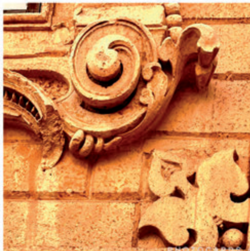
2. Punte lanceolate nel frontone di Santa Teresa a Brindisi (sopra), nelle specchiature ai lati della facciata laterale del Duomo di Lecce (sotto a sinistra), all'angolo di un finestrone del primo ordine del palazzo dei Celestini a Lecce (sotto a destra)