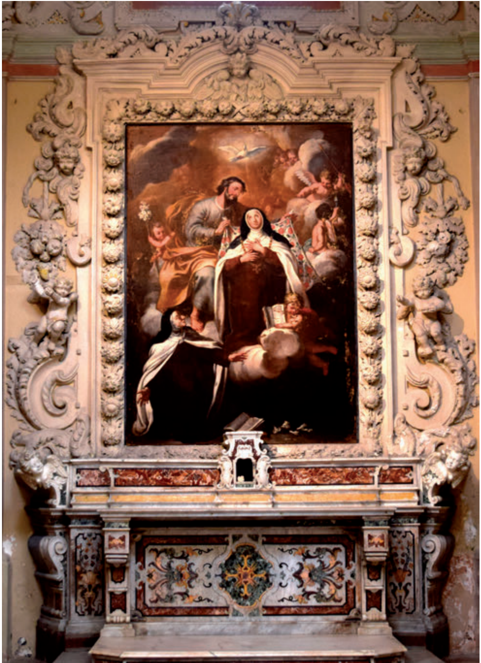
7. Altare di Santa Teresa