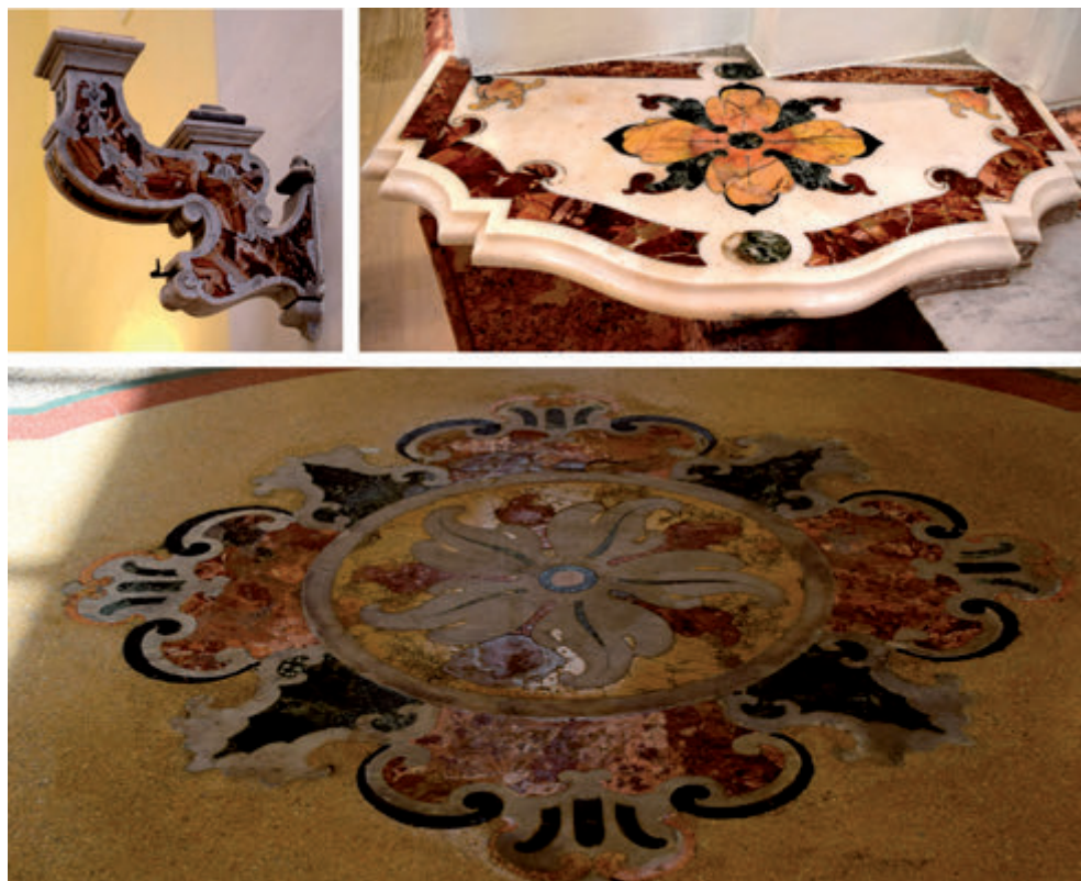
6. Particolari marmorei nella zona presbiteriale (reggicandelabri, mensole policrome, tarsie pavimentali)