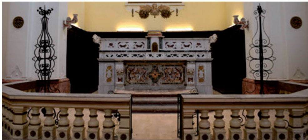
5. Particolare della zona presbiteriale

marmo policromo intarsiato e due pilastri con terminazione a voluta sostengono la mensa. Il paliotto presenta una decorazione a girali vegetali e foglie di acanto entro una cornice mistilinea, con al centro una croce raggiata. Il verbale di consegna della chiesa al Municipio di Brindisi da parte dell'Amministrazione del Fondo per il Culto del 15 luglio 1868 menziona un "altare maggiore di pietra semplice con la mensa in marmo", con ai lati "due porte che immettono al coro e sulle quali sono due statue, l'una di Santa Teresa e l'altra di San Giovanni della Croce" 31 . La descrizione mette in luce un mutamento sostanziale con la sostituzione dell'altare in pietra "a portelle", tipico dell'ambito salentino, con quello attuale, dove infatti i pilastrini cantonali, i due gradini d'altare e il tabernacolo sono frutto di un tardo rifacimento. Ciò che si è conservato (o è stato riadattato), come sottolinea Massimo Guastella, sono i due cherubini capoaltare in marmo che richiamano quelli presenti negli altari delle cappelle laterali di Santa Teresa e del Carmine, suggerendo la possibilità