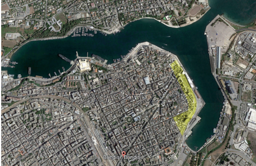
Fig. 1. Brindisi, attuale centro storico, fotografia aerea. In giallo, area di residenza della colonia amalfitana nel Medioevo.