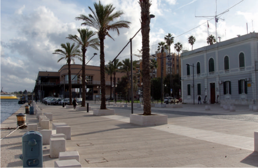
Fig. 3. Veduta dell'attuale banchina del porto interno di Brindisi.