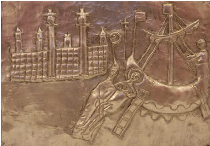
Fig. 2. Traslazione del corpo di san Teodoro a Brindisi , particolare dell'arca reliquiario del santo, legno e lamine d'argento, prima metà del sec. XIII (?). Brindisi, Museo diocesano "Giovanni Tarantini".