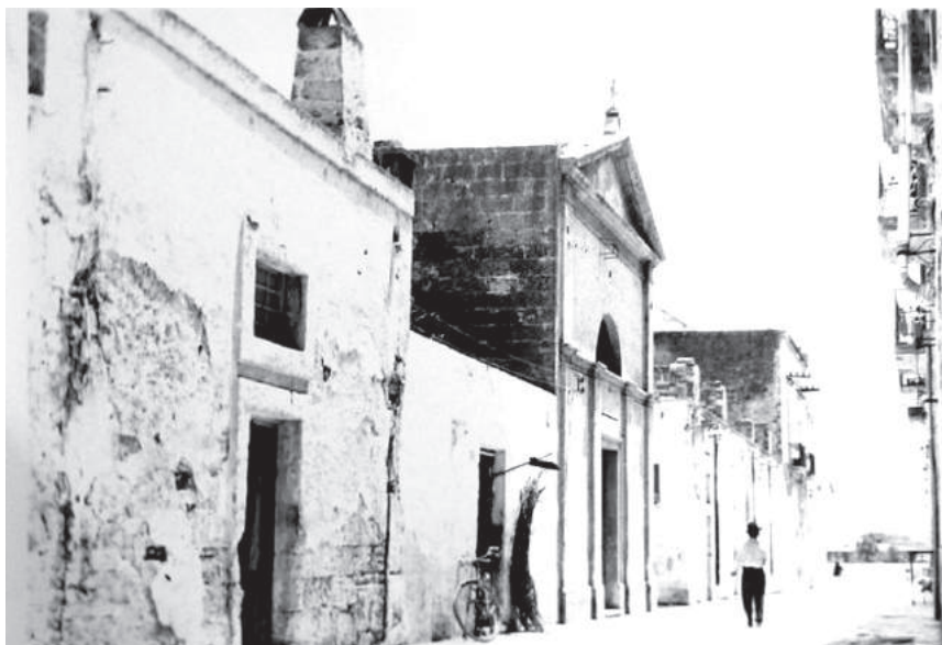
Fig. 7. Veduta della chiesa di Santa Maria della Scala, 1966. Brindisi, biblioteca pubblica arcivescovile "Annibale De Leo", Fototeca Briamo, P3-23.