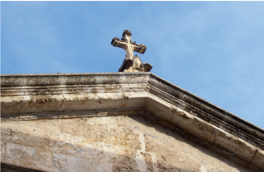
Fig. 4. Croce con alla base il giglio angioino degli Scalesi, particolare della fig. 5.