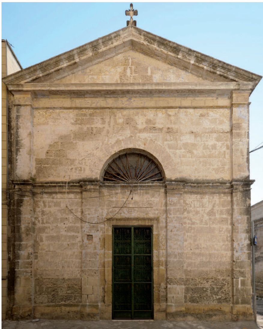
Fig. 5. Brindisi, chiesa di Santa Maria della Scala, attuale prospetto.