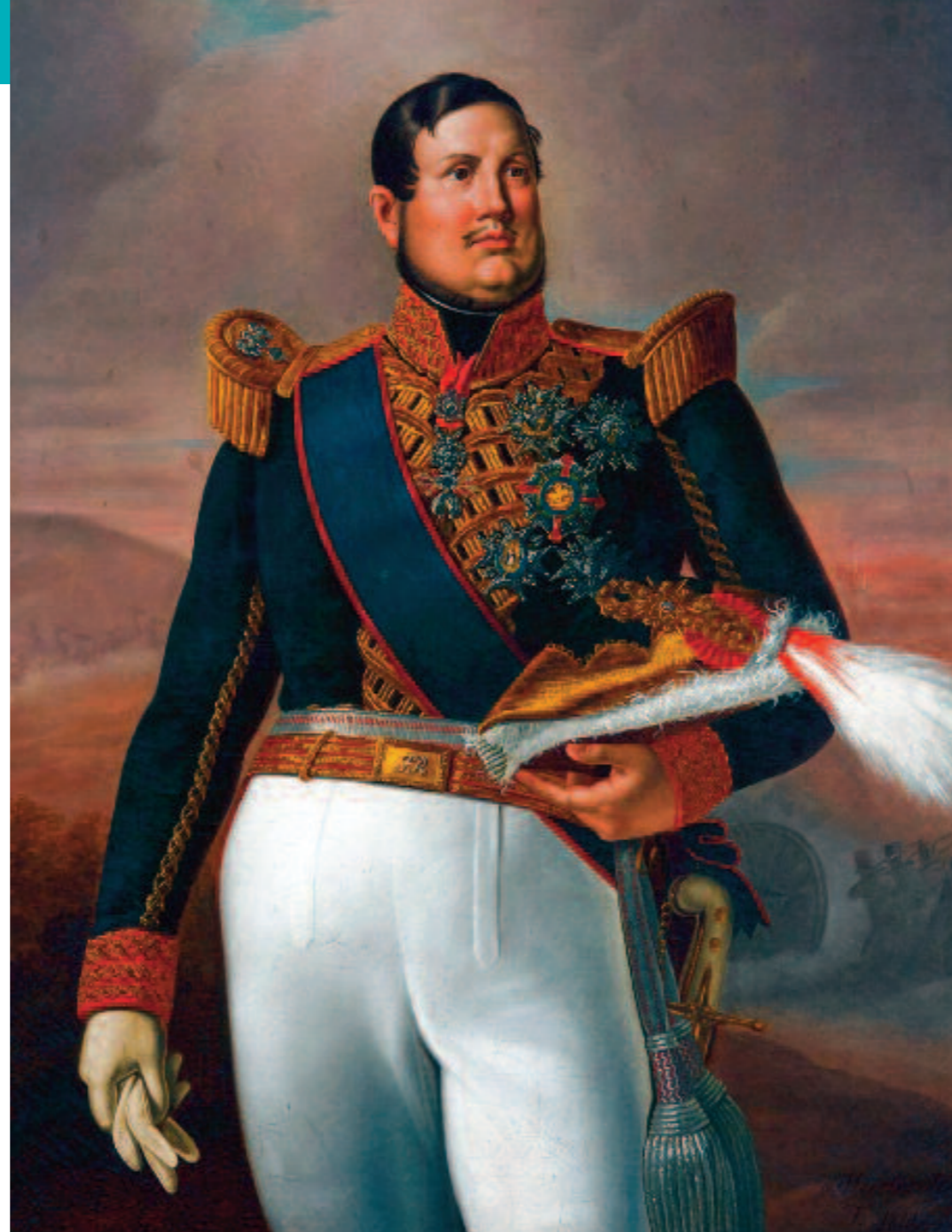
Nella foto grande un ritratto di re Federico II di Borbone, qui a sinistra il vescovo di Brindisi Raffaele Ferrigno. Nella pagina accanto, l'interno del Duomo di Brindisi nell'Ottocento e più in basso il re di Napoli sul letto di morte

curò una infezione purulenta e la setticemia, i pregiudizi contro la iettatura crebbero in maniera inverosimile, tanto da renderlo protagonista di scongiuri indicibili. Attribuì infatti la ragione della sua infermità agli "iettatori" (ripeteva ossessivamente "me l'hanno jettata"), e il rapido peggioramento delle condizioni di salute ai menagramo che aveva incontrato durante il suo ultimo viaggio in Puglia, in particolare all'uomo calvo con il quale aveva incrociato lo sguardo nel Duomo di Brindisi. Senza tener conto dei consigli dei medici e sfidando i rigori dell'inverno, l'8 gennaio del 1859 il re, la regina e tre principi si misero in viaggio verso le province pugliesi, in attesa dell'arrivo a Bari di Maria Sofia di Baviera, sorella della più nota principessa Sissi e sposa del primogenito ed erede al trono Francesco II. Dopo Foggia, Taranto e Lecce, dove i sovrani colsero l'occasione per soggiornare alcuni