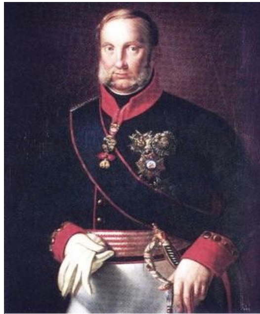
Francesco I-Reggente e poi Re

Il 21 giugno, giorno del Corpus Domini, alcuni carbonari «fecero insultare mosignor vescovo di Brindisi che andava a cavallo colla processione: fecero sparare a mare dentro al porto due cannonate per spaventare il cavallo, e così succedette e il povero prelado si rompeva il collo, e si abbinchiavano di risa i bricconi».