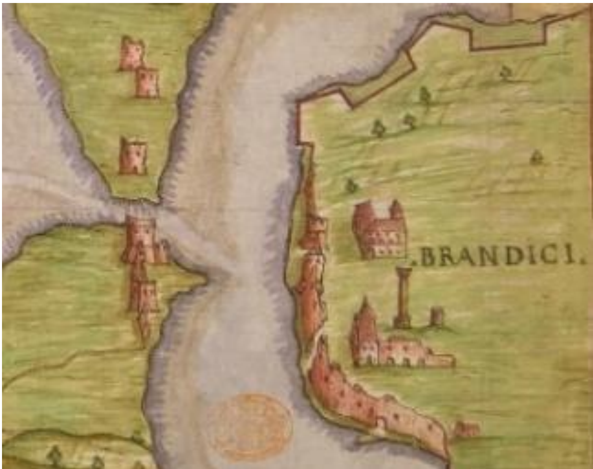
Molino Atlas – 1630 circa.

All'interno delle mura troviamo solo la cattedrale, le colonne romane, e un palazzo dietro Porta Reale sul quale non ho dedicato molto tempo per approfondimenti. Per il resto la città non viene rappresentata, ed all'interno delle mura troviamo solo un bel terreno verde. Questo a conferma che lo scopo principale della mappa, non era tanto la topografia cittadina, quanto la pianta del porto ed il sistema di fortificazione.