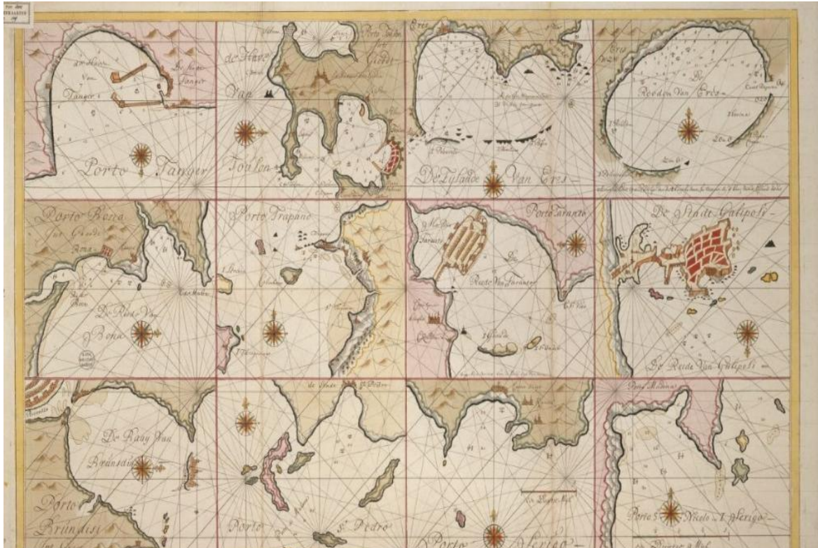
Porto Brundisi – 1720 Leiden University Library