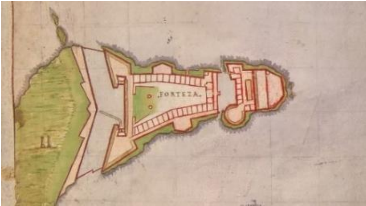
Molino Atlas – 1630 circa. Dettaglio del Castello Alfonsino con il Forte a Mare

Il porto e la sua pianta sono ben rappresentati, con l'evidenza di parte delle isole Pedagne, Fiume Piccolo e le zone paludose della parte di terminale del seno di levante.