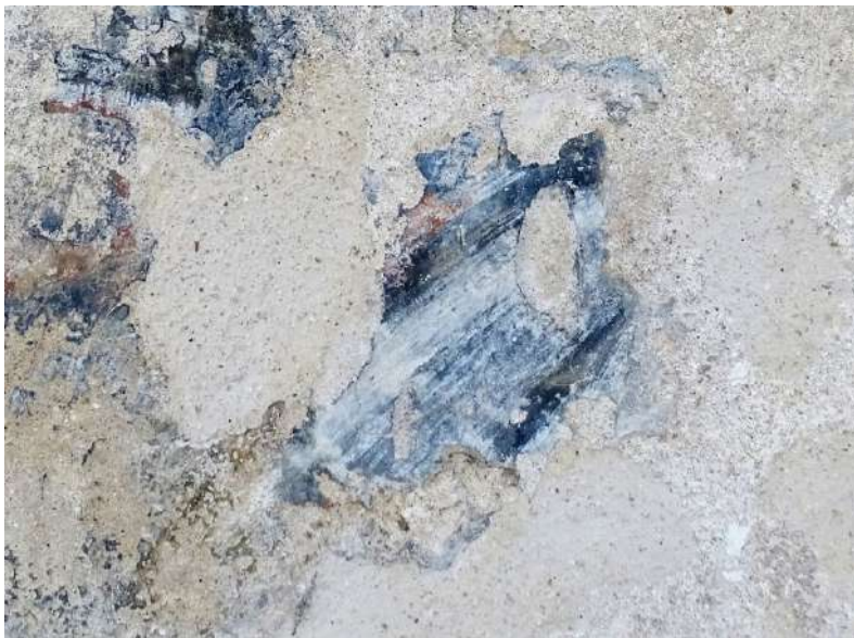
Fig. 6 - Brindisi, chiesa di San Paolo Eremita, parete esterna sud, lacerti ad affresco.