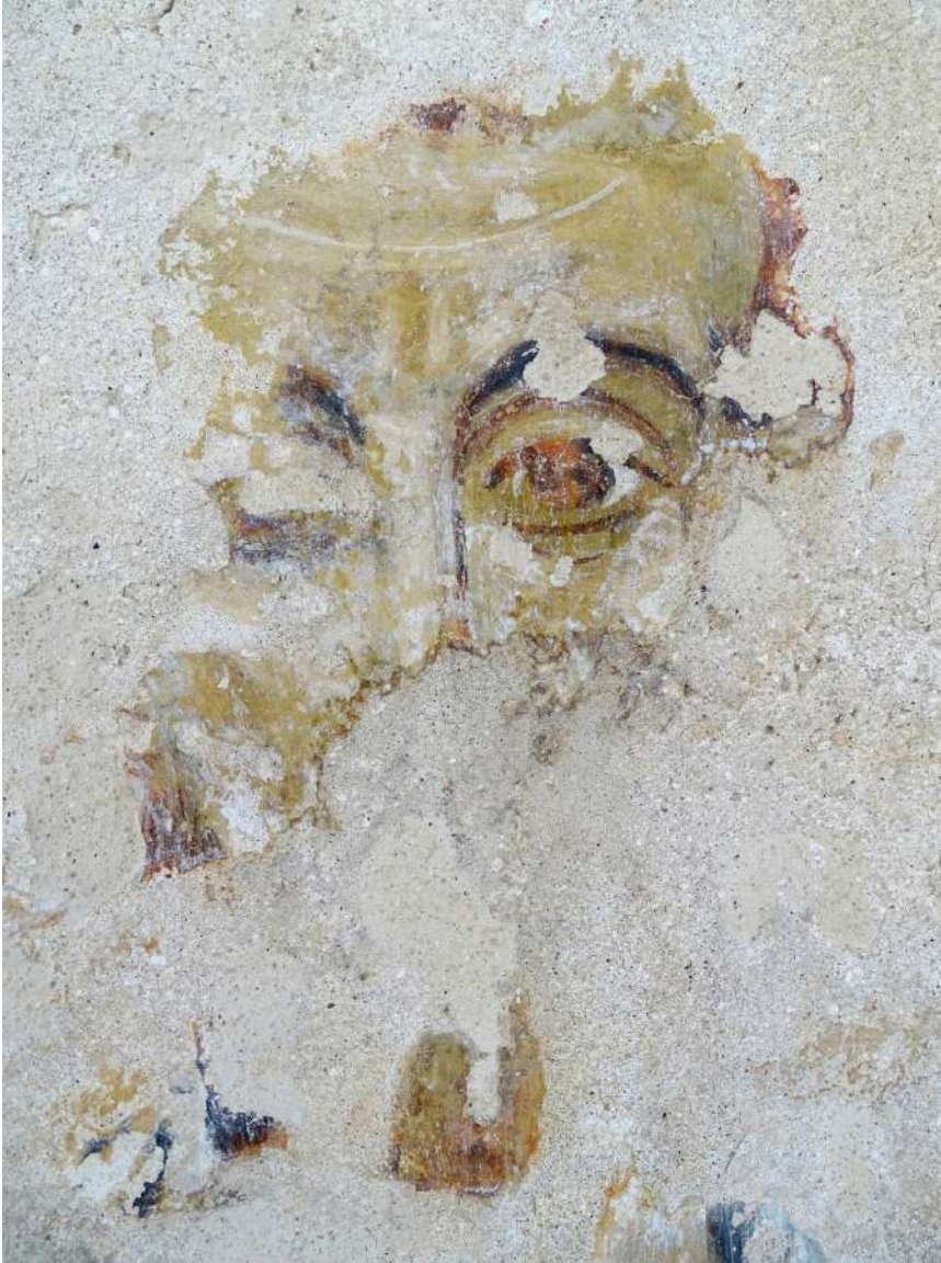
Fig. 4 - Brindisi, chiesa di San Paolo Eremita, parete esterna sud, lacerti ad affresco.