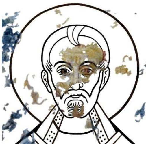
Fig. 11 - Rilievo grafico della testa della fig. 7 con sovrapposizione dei lacerti della fig. 3.