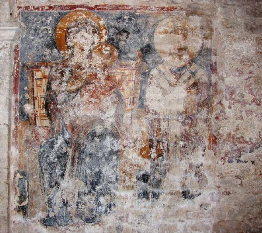
Fig. 8 - Brindisi, chiesa inferiore della Santissima Trinità – Santa Lucia, Madonna in trono col Bambino e san Nicola , affresco.