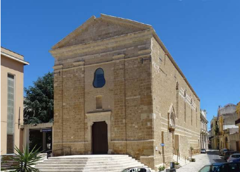
Fig. 1 - Brindisi, chiesa di San Paolo Eremita, esterno.