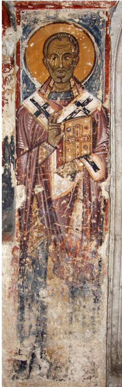
Fig. 7 - Brindisi, chiesa inferiore della Santissima Trinità – Santa Lucia, San Nicola , affresco.