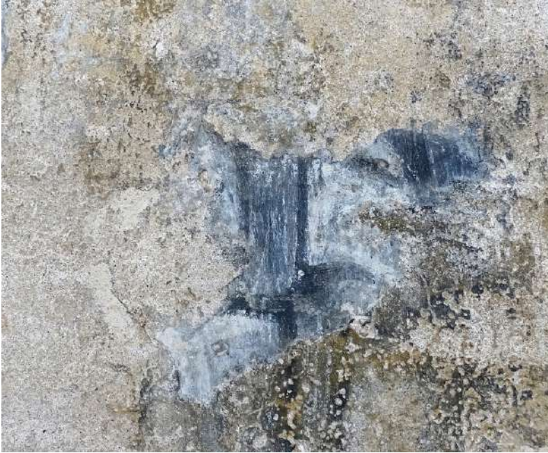
Fig. 5 - Brindisi, chiesa di San Paolo Eremita, parete esterna sud, lacerti ad affresco.