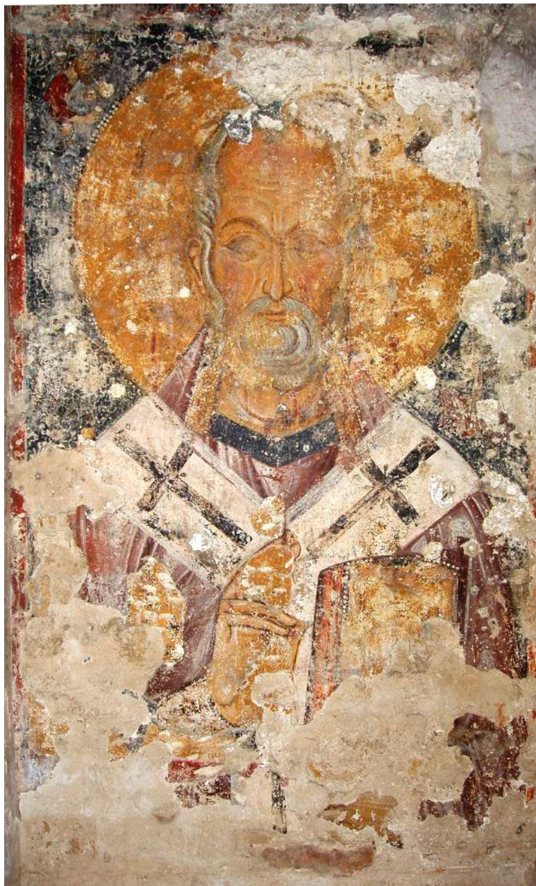
Fig. 9 - Brindisi, chiesa inferiore della Santissima Trinità – Santa Lucia, San Nicola , affresco.