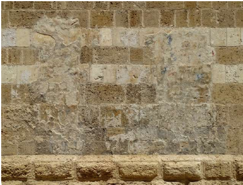
Fig. 2 - Brindisi, chiesa di San Paolo Eremita, parete esterna sud, riquadri a intonaco.