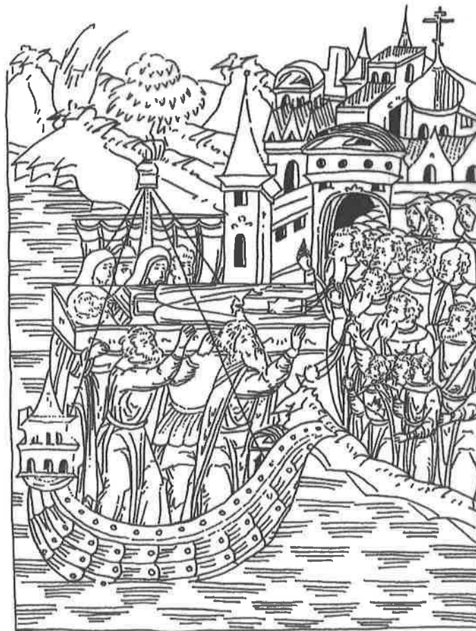
Fig. 4. Vita di san Nicola il Taumaturgo (Žitije Nikolaja Čudotvorca) , manoscritto illustrato, XVI secolo (ed. anastatica, Mosca, 1882). Mosca, Biblioteca Nazionale Russa, Ms. F. 37, Fondo Bolšakov, n. 15.