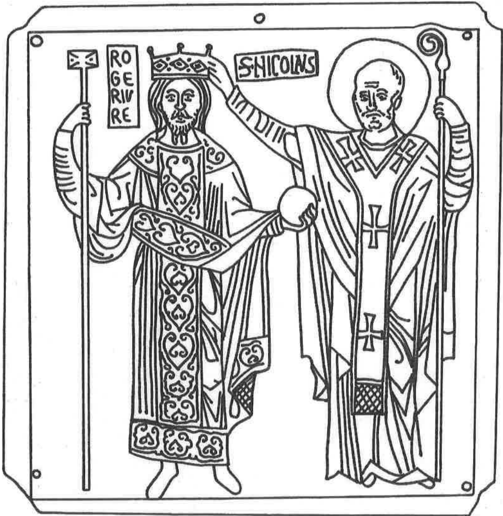
Fig. 1. San Nicola incorona re Ruggero II , 1132 circa, placca in rame dorato, smalto champlevé e niello. Bari, Tesoro della basilica di San Nicola.