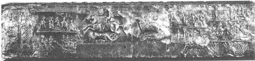
Fig. 2. Arca di san Teodoro. Brindisi, Museo Diocesano "Giovanni Tarantini".