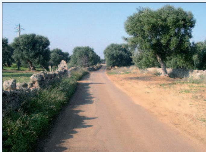
Figura 7 - Il tratto pugliese sovrapposto al percorso della Via Appia Traiana

zione delle “miliare”, insiemi di canale e strada posti ortogonalmente alla Via Appia alla costante distanza di un miglio, costituisce invece un esempio di come la strada abbia costituito la “traccia ordinatrice” della nuova strutturazione agraria a forma di “pettine”, che cancellò quella di epoca romana ruotata rispetto alla nuova di 45°. E’ interessante notare come la bonifica di epoca fascista abbia ripreso ed esaltato, nell’impianto generale, la struttura delle “miliare”, proseguendo alcune di queste fino alla fascia costiera di Latina e Sabaudia.