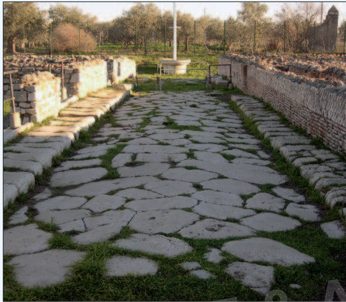
Figura 6 - I resti di basolato a Venosa (PZ)

Tuttavia fino ad oggi la tutela archeologica è stata relegata in quelle che sono definite come “aree archeologiche”, intese come aree di più o meno limitate dimensioni, generalmente recintate e il cui accesso è in qualche modo regolato. In tempi più recenti, si è introdotto il tema dei “parchi archeologici”. Il Codice dei beni culturali e del paesaggio contiene un esplicito riferimento a tali parchi definiti come “ambito territoriale caratterizzato da importanti evidenze archeologiche e dalla compresenza di valori storici, paesaggistici o ambientali, attrezzato come museo all’aperto”.