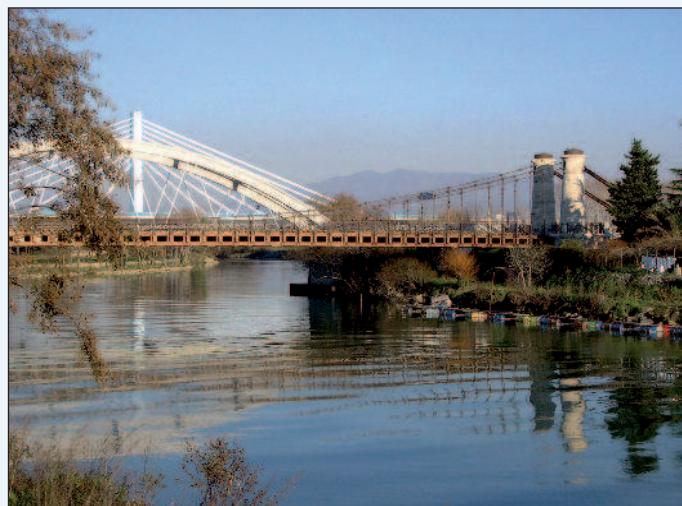
Figura 4 - Il ponte dell'Appia sul fiume Garigliano ristrutturato nell'Ottocento in stile neo-egizio. Sullo sfondo, i ponti moderni

Nei primi anni del Novecento, mentre il sedime originario dell'Appia Antica si dividerà in differenti destini legati alla conservazione o al progressivo abbandono e degrado dei vari tratti, la nuova Strada Statale 7 "Appia", nella sua funzione di principale via di collegamento dell'Italia centro-meridionale, assumerà il ruolo di connessione tra importanti aree in via di sviluppo. Tra queste, le aree agricole con relativi borghi nei territori della bonifica post-unitaria: nella Campagna Romana, nella Pianura Pontina, nell'Agro Falerno e nel Tavoliere delle Puglie. Nel secondo Dopoguerra, infine, la strada sarà interessata dall'insediamento, in prossimità del tracciato, di numerose aree di sviluppo industriale, realizzate sotto l'impulso della Cassa per il Mezzogiorno. Si tratta delle aree dell'Agro Pontino, del casertano, dell'Irpinia e quelle in territorio pugliese.