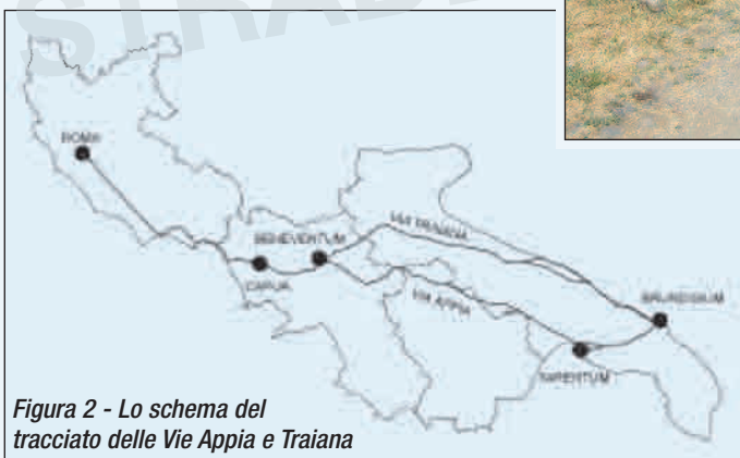
Figura 2 - Lo schema del tracciato delle Vie Appia e Traiana

La storia dell'Appia è strettamente legata alla crescita del dominio romano. La strada fu costruita con lo scopo di congiungere i centri che l'espansione militare di Roma aveva conquistato a partire dalla prima Guerra Sannitica (342 a.C.).