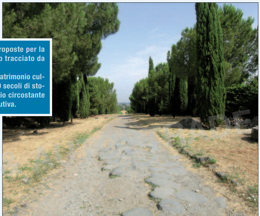
Figura 1 - I resti del basolato della Via Appia Antica alle Frattocchie, pochi chilometri a Sud di Roma

Il raggiungimento della massima funzionalità del tracciato lo si con-