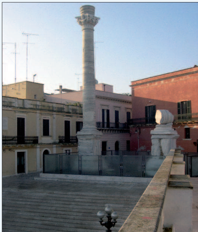
Figura 3 - Le colonne terminali dell'Appia a Brindisi

In epoca moderna la Via Appia e le sue varianti pedemontane verranno usate per ingressi e parate trionfali verso Roma e verso Napoli da parte di Re, Eserciti e Imperatori, per poi essere successivamente inserite negli itinerari del Grand Tour, in particolare come percorso di grande valenza paesaggistica tra Roma e Napoli, nonostante l'elevato grado di pericolosità legato al diffuso fenomeno locale del brigantaggio.