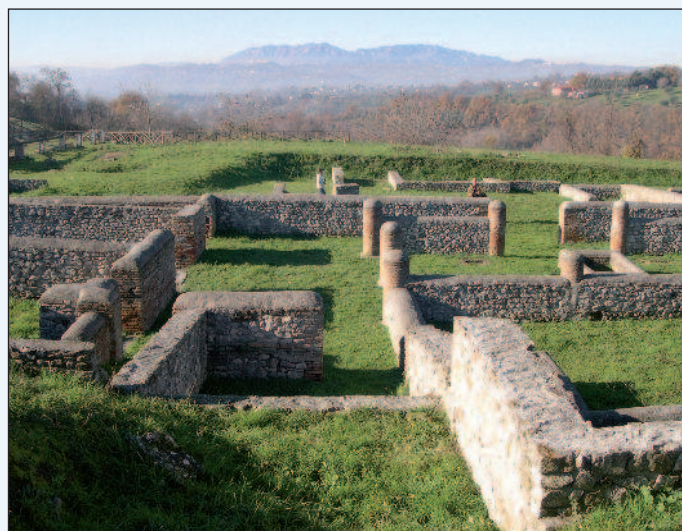
Figura 5 - Rovine romane ad Aeclanum, in Campania

E' questa sicuramente la ragione principale per cui, malgrado tutte le distruzioni e le devastazioni che si susseguirono nei secoli, è stata possibile la sopravvivenza di un numero ancora così alto di testimonianze distribuite lungo il suo tracciato.