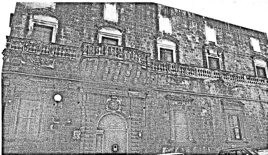
Casarano. Palazzo d'Elia.