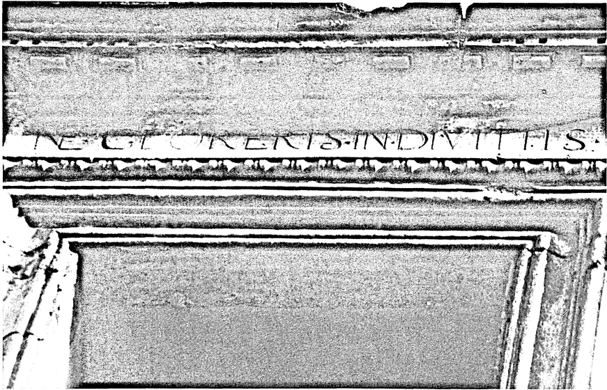
Brindisi. Palazzo Scolmafora, particolare. Vi si legge: Nec gloriaris in divitiis (non gloriarti nelle ricchezze) - Foto Cosimo Prudentino.

cali di Tommaso, suo bisavo 29 , corrispondono, nell'ultimo dei Briganti, clericalismo e legittimismo 30 . E la fedeltà alla dinastia borbonica mi sembra organica alla storia della famiglia Briganti poiché non credo che si possa dissentire dal fatto che anche il pensiero di Tommaso senior e di Filippo assuma una connotazione