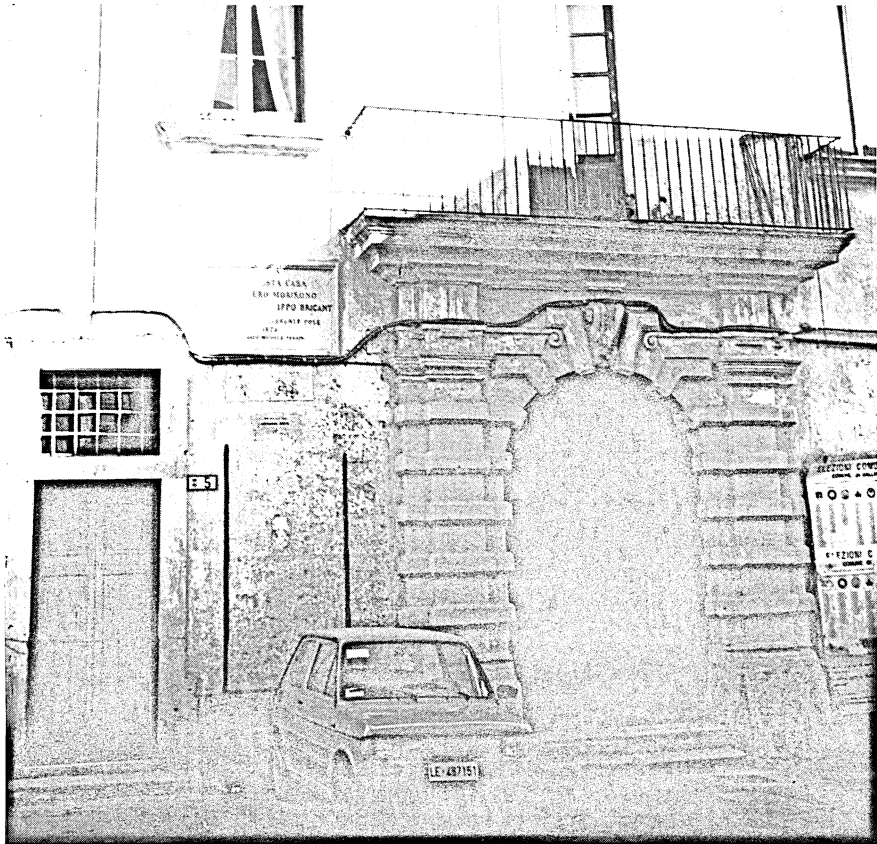
Gallipoli. Palazzo Briganti.

«Gli pseudonimi adottati dal Lezzi rinviano alla sua passione municipalistica e al suo luogo di nascita [Casarano]: ... filopatride indica, infatti, un generico attaccamento alla patria ... [Cesareo e Cesariense invece rinviano indubbiamente a Casarano] 15 città fondata da Cesare o da Ottaviano Cesare secondo un'etimologia proposta dallo stesso Lezzi ...» 16 .