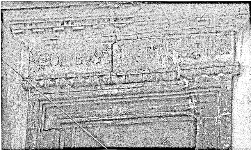
Brindisi. Palazzo Scolmafora, particolare. Vi si legge: Combusta vivescit 1682 (bruciata ritorna a vivere nel 1682)