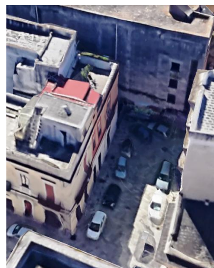
Largo Jacopo Pipino, vicino piazza Mercato