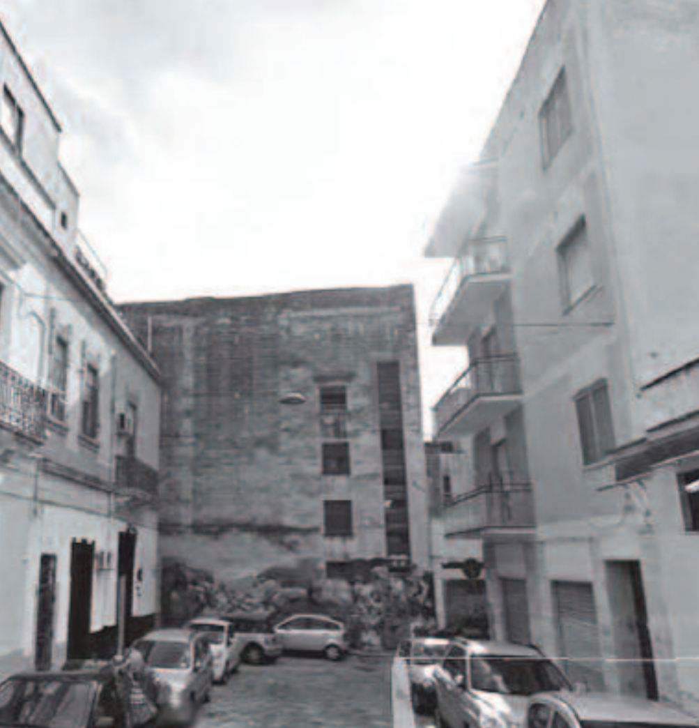
Sopra e a destra due vedute di Largo Jacopo Pipino, vicino piazza Mercato. A sinistra Jacopo Pipino

della moglie. Del Magister Jacobus, infine, non si trovano poi più notizie dopo il 1326, anno in cui è quindi da supporre che Giacomo Pipino - 700 anni fa - sia deceduto, sessantenne. In tale anno esaminò per conto del re, un tale "magister Matheus" per il conferimento della licenza d'esercizio della professione di medico.