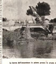
La banca dell'escavatore in alcune parti della strada sulla SS. 136