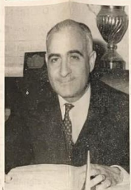
Il Dott. Franco Armati, sindaco di Brindisi, sta per il laboratorio di lavoro in un'aula della città.

Gli sforzi non sempre vengono compresi e causano pareri e reazioni critiche di parte avversa per chi si vuole lasciare il segno di un'opera esemplare e sveglia