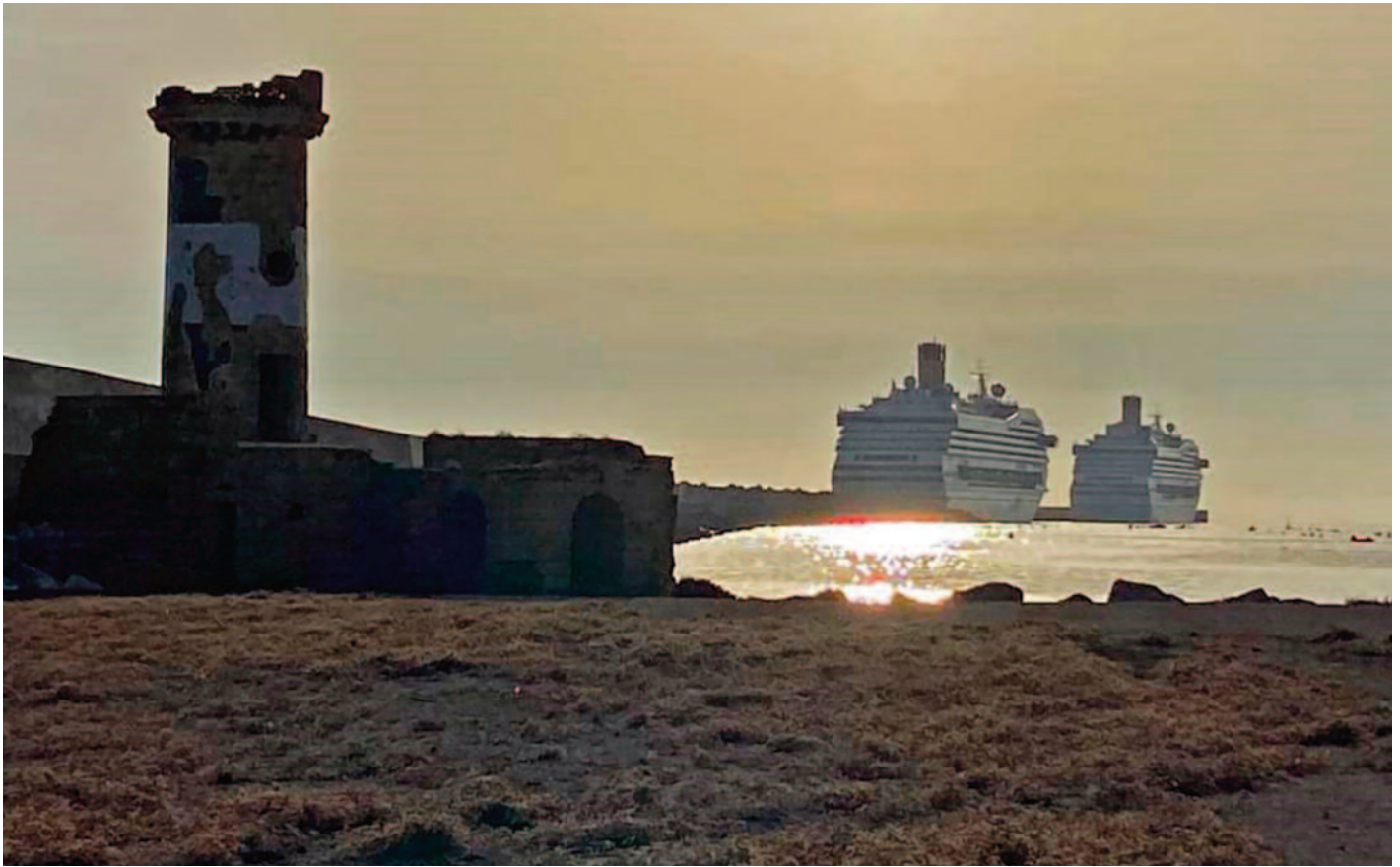
LE IMMAGINI Una bellissima alba sull'isola di Sant'Andrea, a destra l'interno della chiesa di Jaddiso. Sotto il titolo visitatoti alla cripta di San Biagio

è divenuta propaggine verso est, della precedente, è divenuto come il dito indice della mano della città che si proietta nel mare divenendone manifesto d'ospitalità di un approdo sicuro, negato mai a nessuno.