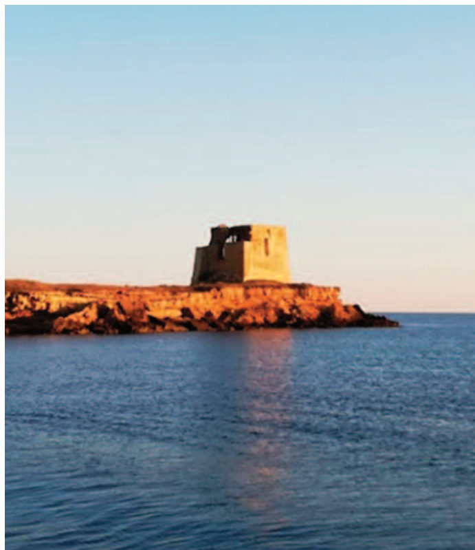
LE IMMAGINI A sinistra un particolare di un affresco all'interno della cripta di San Biagio, a destra Torre Testa del Gallico, qui accanto un tramonto sulla masseria Jannuzzo

è in costruzione un enorme viadotto che fra qualche mese renderà inutile l'antico piccolo casello e le sbarre bianco e rosse che uno stanco casellante muoveva all'arrivo del treno, lasciando in attesa e in fila, modeste code di trattori e qualche autovettura che frequentava lenta quella porzione di territorio. La modernità sottrarrà anche questo piccolo tratto di terre e patrimonio alla lentezza. Al sud abbiamo bisogno di più treni veloci, per rallentare l'emorragia di cervelli e competenze che qui non trovano realizzazione.