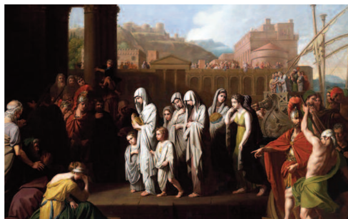
Sopra Gavin Hamilton, Agrippina approda a Brindisi con le ceneri di Germanico, a destra la stessa scena rappresentata da Alexander Runciman e da Benjamin West del 1768, quest'ultima opera conservata alla Yale University Art Gallery. A sinistra un busto raffigurante Germanico

di Brindisi, proferendo un sortilegio che negava il diritto alla memoria, ai suoi abitanti e alla loro progenie.