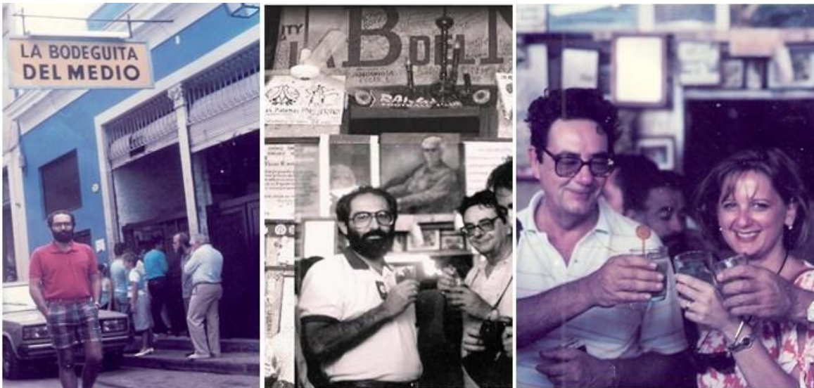
La Bodeguita del medio: lo storico bar di Hemingway dove si inventò il famoso “Mojito”

Una citazione speciale merita poi quel piccolo vecchio bar che, con il bancone abbastanza schiacciato sull’entrata prospiciente allo stretto marciapiede e con le sue due salette annesse, si trovava e si trova ancora in una anonima viuzza del centro dell’Havana: “ La bodeguita del medio ” anch’esso sopravvissuto alla rivoluzione conservando ancora fino a quei giorni gli stessi mobili, gli stessi arredi e le stesse pareti integralmente tappezzate con graffiti, posters pubblicitari e fotografie con dediche di avventori indistintamente famosi ed anonimi, primo e certamente più famoso tra tutti Ernest Hemingway, lo stravagante scrittore americano autore di tanti capolavori letterari, che visse per circa vent’anni a La Havana dal 1938 fino alla sua tragica morte avvenuta nel 1961. Hemingway era un cliente fisso de La bodeguita del medio e la leggenda vuole che fu proprio lui a dare un contributo notevole a far creare il famoso “ Mojito ”.