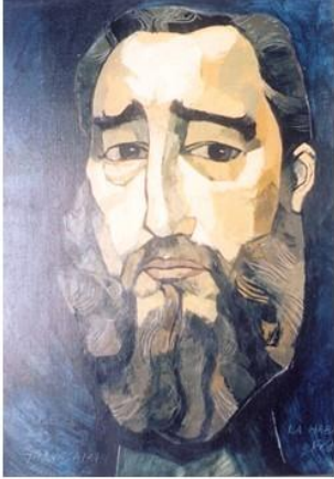
Fidel Castro - olio di Guayasamin

Nella stanza immediatamente antecedente il salone, troneggiava un gran bel ritratto ad olio di Fidel Castro fattogli dal famoso pittore ecuadoriano Guayasamin, amico suo e che anch'io avevo conosciuto una decina di anni prima quando lo avevo visitato qualche volta nella sua galleria-atelier di Guayaquil, negli anni del mio servizio civile in quella città ecuadoriana.