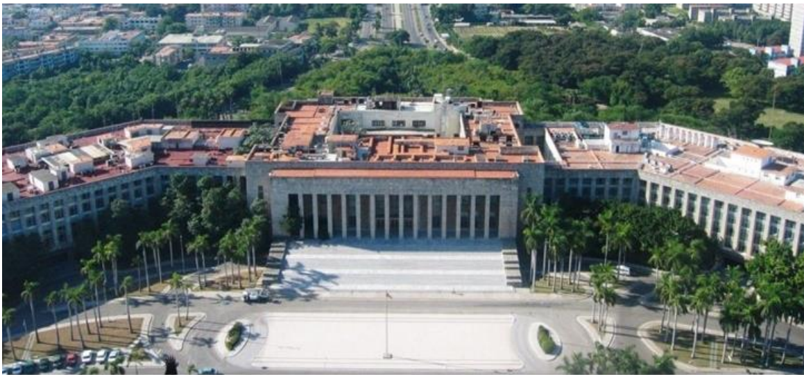
Il Palazzo di Governo in Piazza della rivoluzione - La Habana

Sul cancello d'entrata, dopo un paio di guardie uniformate, c'era una specie di corpo di guardia con molti funzionari civili, tutti abbastanza anziani, da 60 anni in su, e ci fu poi raccontato fossero gli incaricati della sicurezza personale del comandante, tutti rigorosamente reduci rivoltosi della Sierra Maestra.