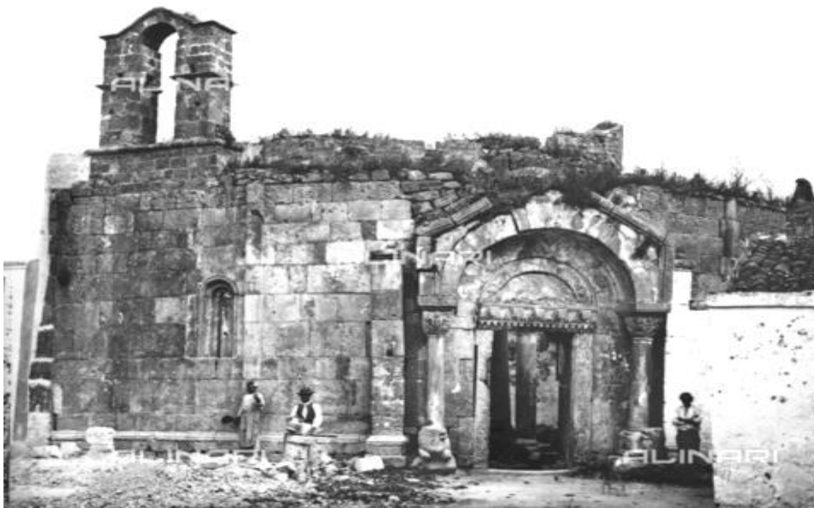
San Giovanni ai tempi della visita di Charles Yriarte - 1883