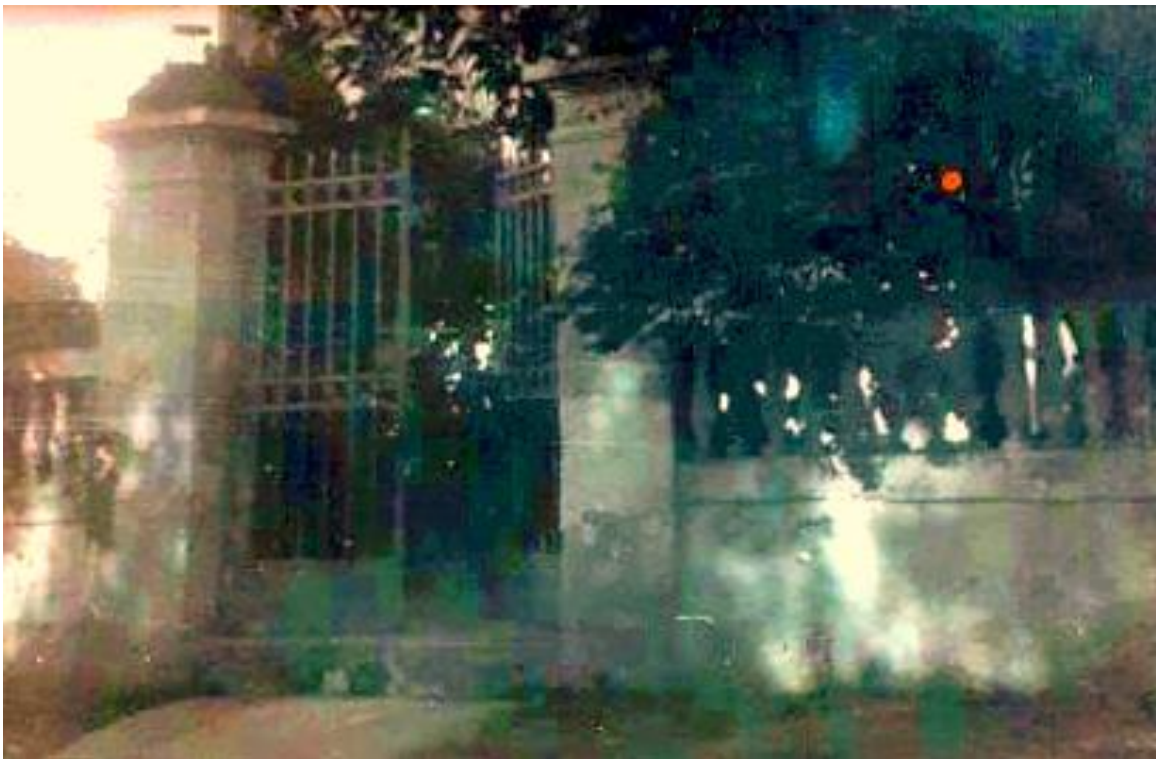
La casa di Carlo Losito dal Casale in via Bafile 5