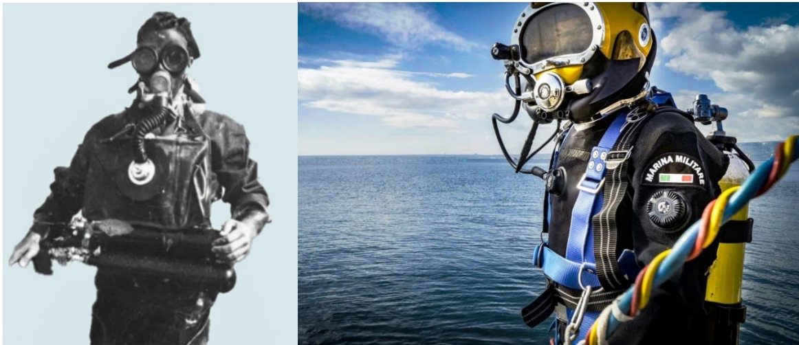
I palombari della Marina Militare: nella seconda guerra mondiale e oggi