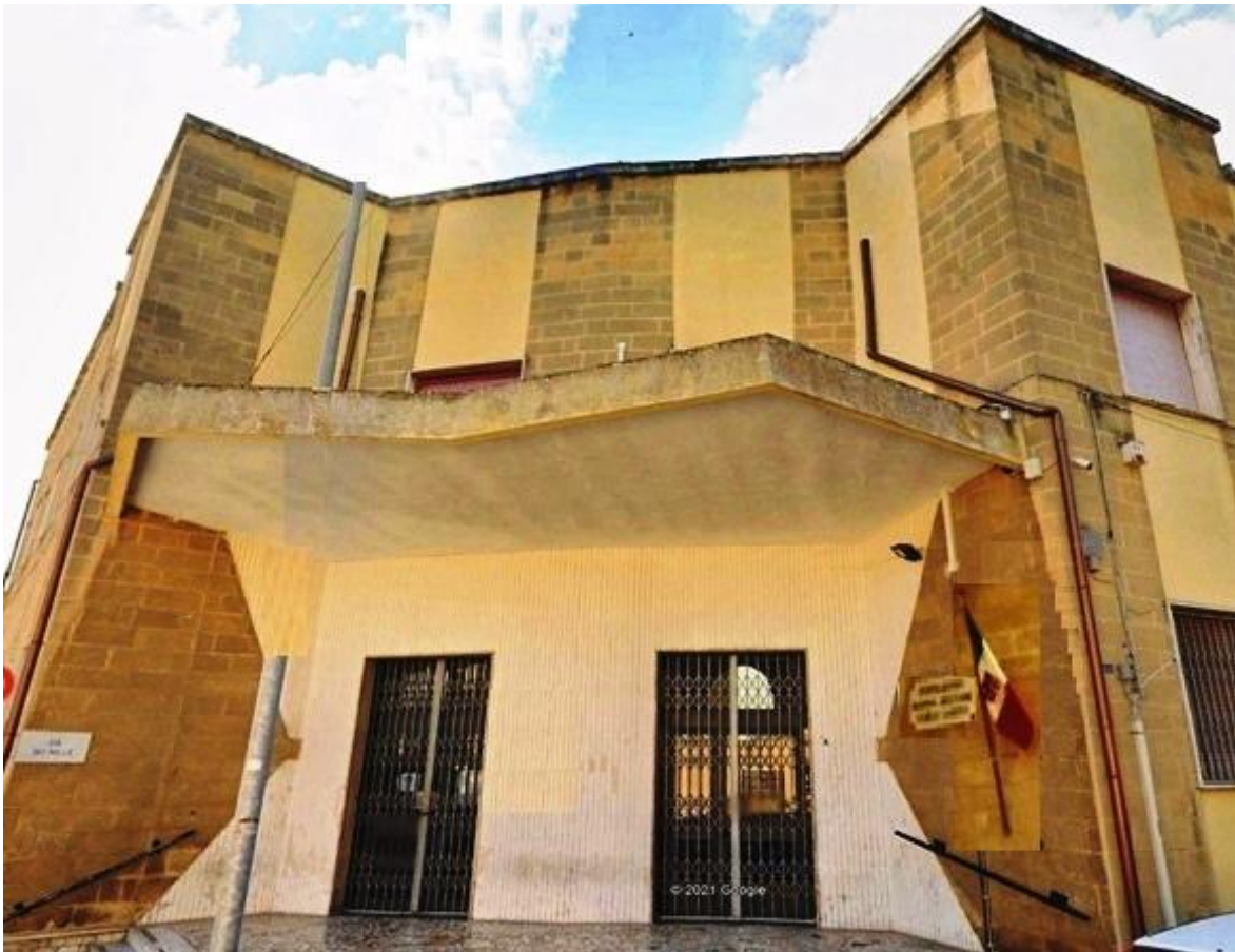
CRAL Marina C. LOSITO - BRINDISI