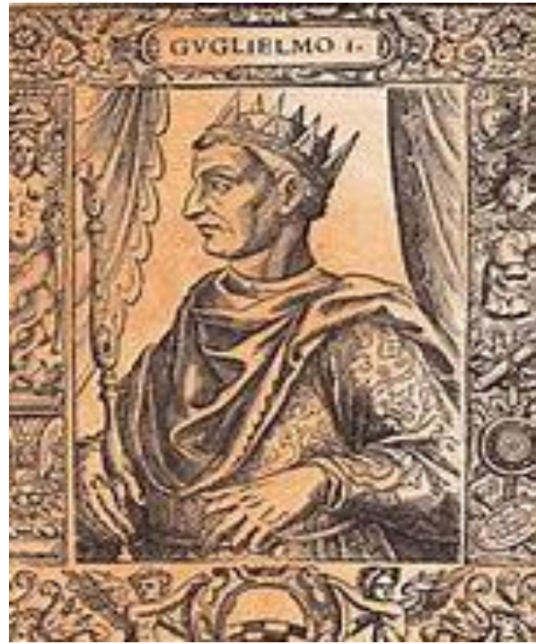
Guglielmo I re di Sicilia - detto "il malo"