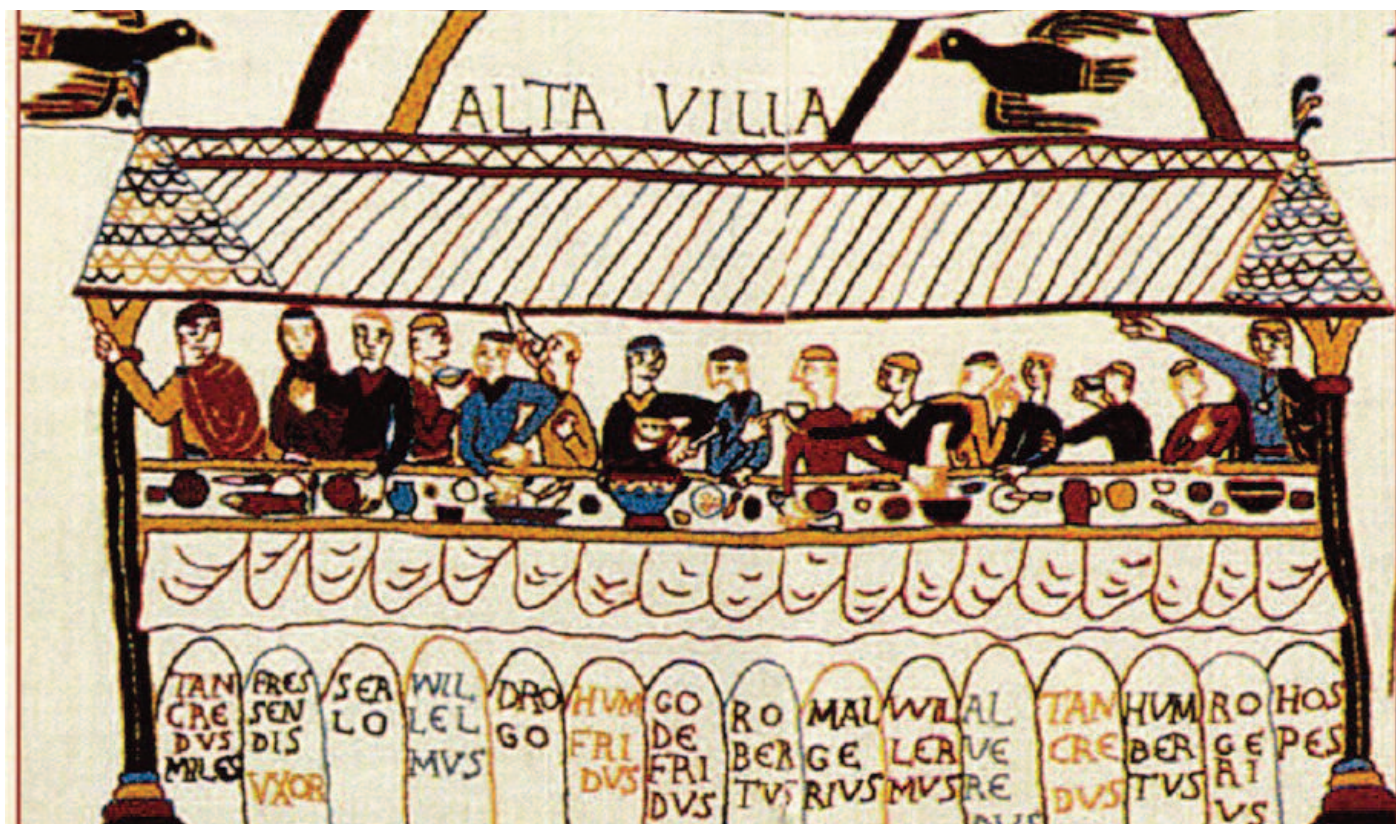
LE IMMAGINI Tancredi, signore di Hauteville con la sua seconda moglie Fressenda a tavola con i dodici figli maschi

ganizzato il suo esercito, ai primi del 1156 attraversò lo stretto risalendo lo stivale con le sue forze terrestri mentre la sua marina puntò direttamente su Brindisi, tenacemente assediata dai soldati bizantini i quali, comandati da Giovanni Dukas e contando con la complicità dei loro numerosi partigiani locali, avevano penetrato le mura cittadine e avevano posto l'assedio alla "rocca" in cui si erano asserragliati i soldati normanni rimasti fedeli al re, cercando invano per 40 giorni di espugnarla anche dal mare con Alessio Comneno, nipote dell'imperatore, inviato con nuove navi cariche di soldati a rilievo di Michele Paleologo, morto a Bari.