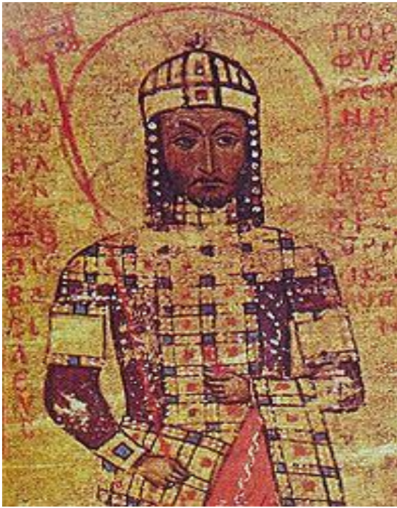
L'imperatore d'Oriente Manuele I Comneno