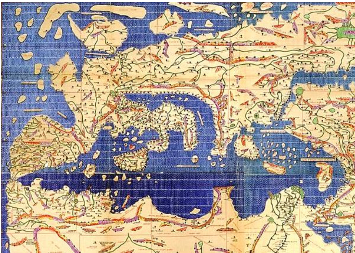
Mappa di Al Idrisi del 1154 - dettaglio