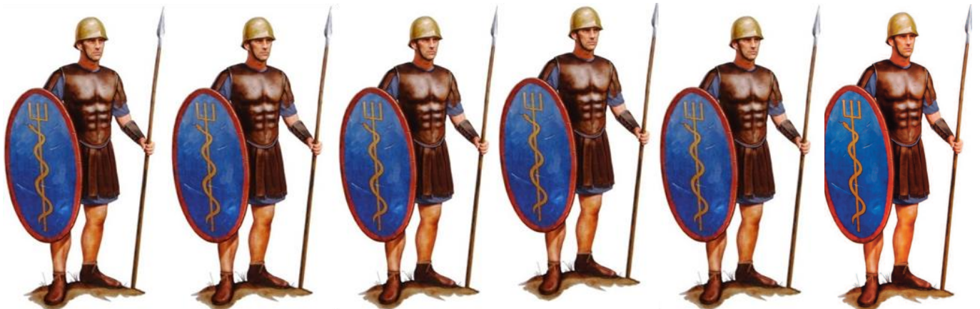
Milites classarii: soldati romani di marina

D'altra parte, però, se un trentennio dopo i fatti di Brundisium la semplice accusa di scarsa severità con gli schiavi fu causa di morte per la nobile Domizia Lepida, vuol dire che la paura provocata dalla possibile rivolta delle masse servili era pur sempre viva, anche perché gli schiavi del Salento erano restati indomabili e, di fatto, non atterriti nemmeno dalla crocifissione. Certo è, comunque, che quell'episodio in apparenza puntuale meriterebbe molti altri approfondimenti: per esempio sul gran numero degli schiavi presenti intorno a Brindisi, sui torbidi che potevano scoppiare da un momento all'altro localmente ma con ripercussioni perfino nella lontana capitale dell'impero, sul tempestivo e feroce intervento delle forze repressive romane, e molto altro. Ma sarà per qualche altra buona occasione!