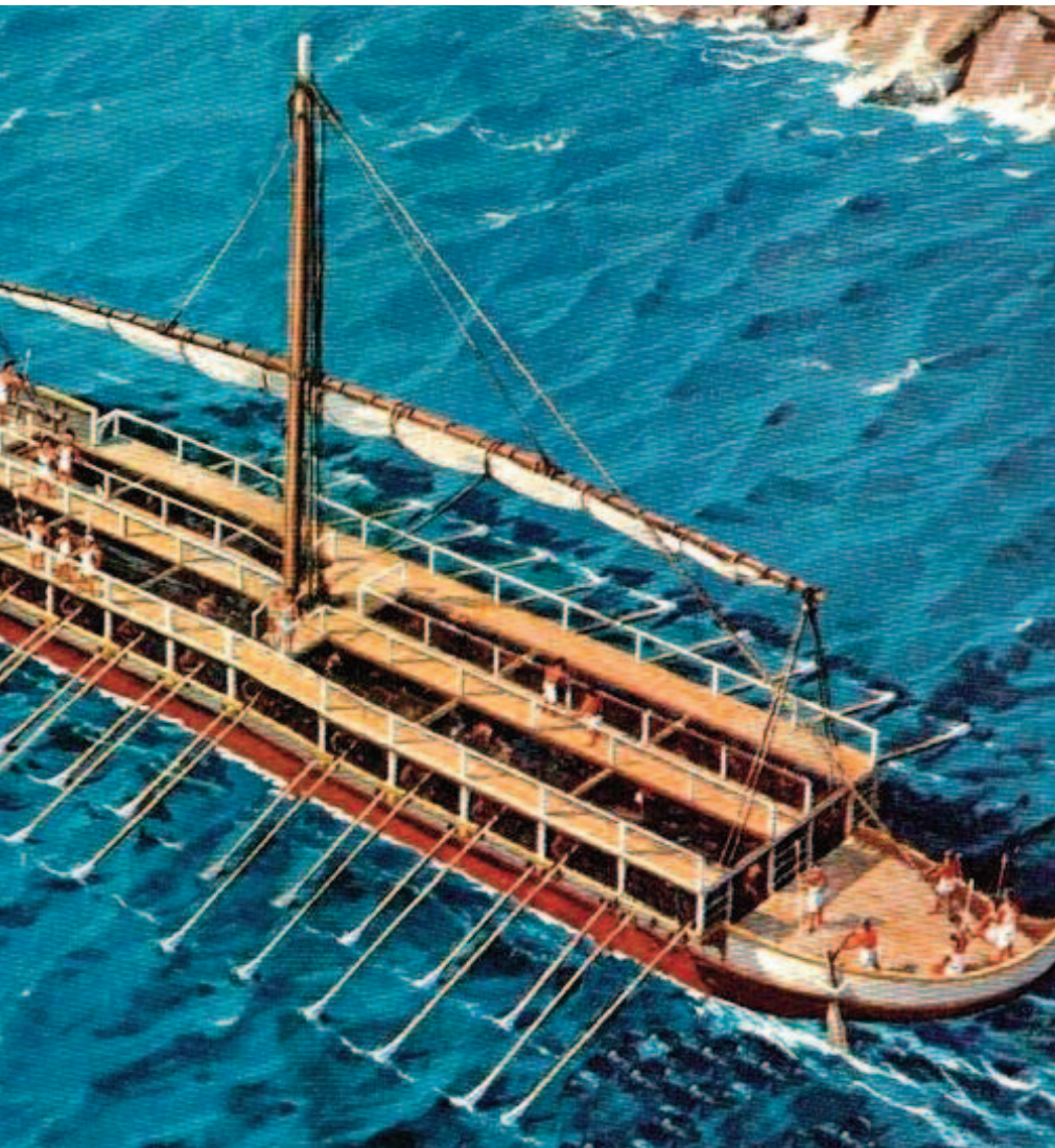
LE IMMAGINI A sinistra una biremi romana, in basso un'immagine della rivolta degli schiavi

frequenza un grosso problema per la classe dominante romana, mentre non mancò chi pensò bene di sollecitare, o finanche aizzare, quelle masse schiave per rivoltarle contro il potere costituito. Per solo citare il caso più famoso: quando nel 73-71 a.C. Spartaco, fuggito dalla scuola gladiatoria di Capua mise a soqquadro l'ordine repubblicano, inseguito dalle truppe di Crasso raggiunse il corso del Sele e per sfuggire alla morsa, come ultima carta, cercò di raggiungere il passo di Conza, con l'idea di scendere in Puglia e sollevare le enormi masse servili presenti in quel territorio. E forse ci sarebbe anche riuscito se non gli fosse stato sbarrato il passaggio, obbligandolo quindi a battersi e, inevitabilmente, a soccombere alle armi romane.