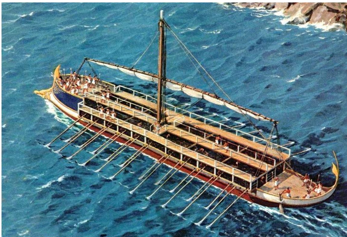
Biremi romana e soldati romani di marina, i Miles classarii

D'altra parte, però, se un trentennio dopo i fatti di Brundisium la semplice accusa di scarsa severità con gli schiavi fu causa di morte per la nobile Domizia Lepida, vuol dire che la paura provocata dalla possibile rivolta delle masse servili era pur sempre viva, anche perché gli schiavi del Salento erano restati indomabili e, di fatto, non atterriti nemmeno dalla crocifissione. Certo è, comunque, che quell'episodio in apparenza puntuale meriterebbe molti altri approfondimenti: per esempio sul gran numero degli schiavi presenti intorno a Brindisi, sui torbidi che potevano scoppiare da un momento all'altro localmente ma con ripercussioni perfino nella lontana capitale dell'impero, sul tempestivo e feroce intervento delle forze repressive romane, e molto altro. Ma sarà per qualche altra buona occasione!