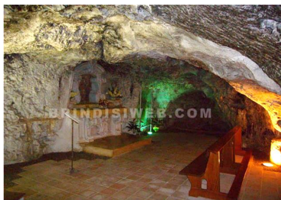
Cripta della Madonna del Belvedere