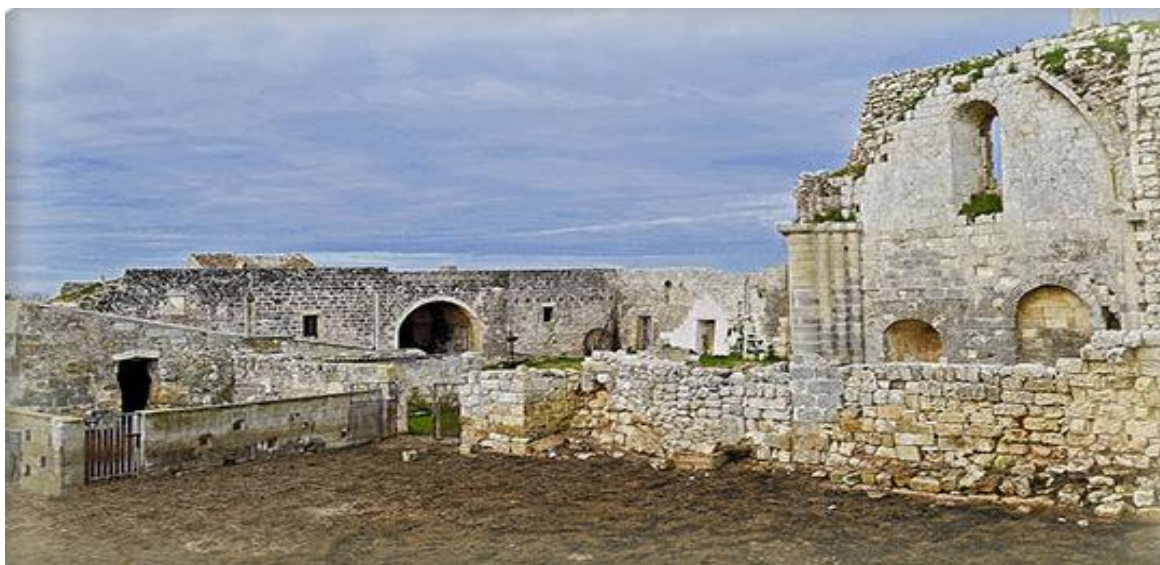
Monastero di San Nicola di Casole

Tra i tanti indicati, il più ragguardevole e famoso monastero basiliano in Puglia fu certamente quello di San Nicola di Casole presso Otranto. Eretto nella seconda metà del secolo XI, fu saccheggiato fino ad essere quasi completamente distrutto dai Turchi nella presa di Otranto del 1480. Ad esso appartennero numerose ricche grancie e parecchi calogerati, di Terra d'Otranto e anche di fuori.