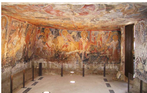
Cripta di San Biagio

Acerenza (« Cabria »), Brindisi (« S. M. de Forellis », « S. M. de Balneo », « S. M. della Croce », « S. Andrea de Insula »), Gallipoli (« S. M. de Balneo », « S. Mauro », « S. Salvatore »), Lecce e dintorni (« S. M. de Cerrate », « S. Giorgio » in Surbo, « S. Maria di Contataedri », « S. M. di Lovito » o Lomito, « S. M. de Nuce »), Melendugno (« S. Niceta »), Nardò (« S. Angelo della Salute », « S. Elia », « S. Giovanni di Coloneto o Calibita », « S. M. de Alto », « S. M. de Bagno », « S. M. de Cibo » o Civo, « S. M. de Cesaria », « S. Nicola », « S. Nicola de Galliis o de Pergulite », « S. Stefano »), Otranto e dintorni (« S. M. de Croce o Croce », « S. Nicola di Casole », « S. Giorgio » di Corigliano, (le « Cento Porte » in Giurdignano ?), Taranto (« S. M. di Calzano o Talzano », « S. Pietro », « S. Andrea »), Venosa (« S. Martino », « S. Nicola di Morbana »).