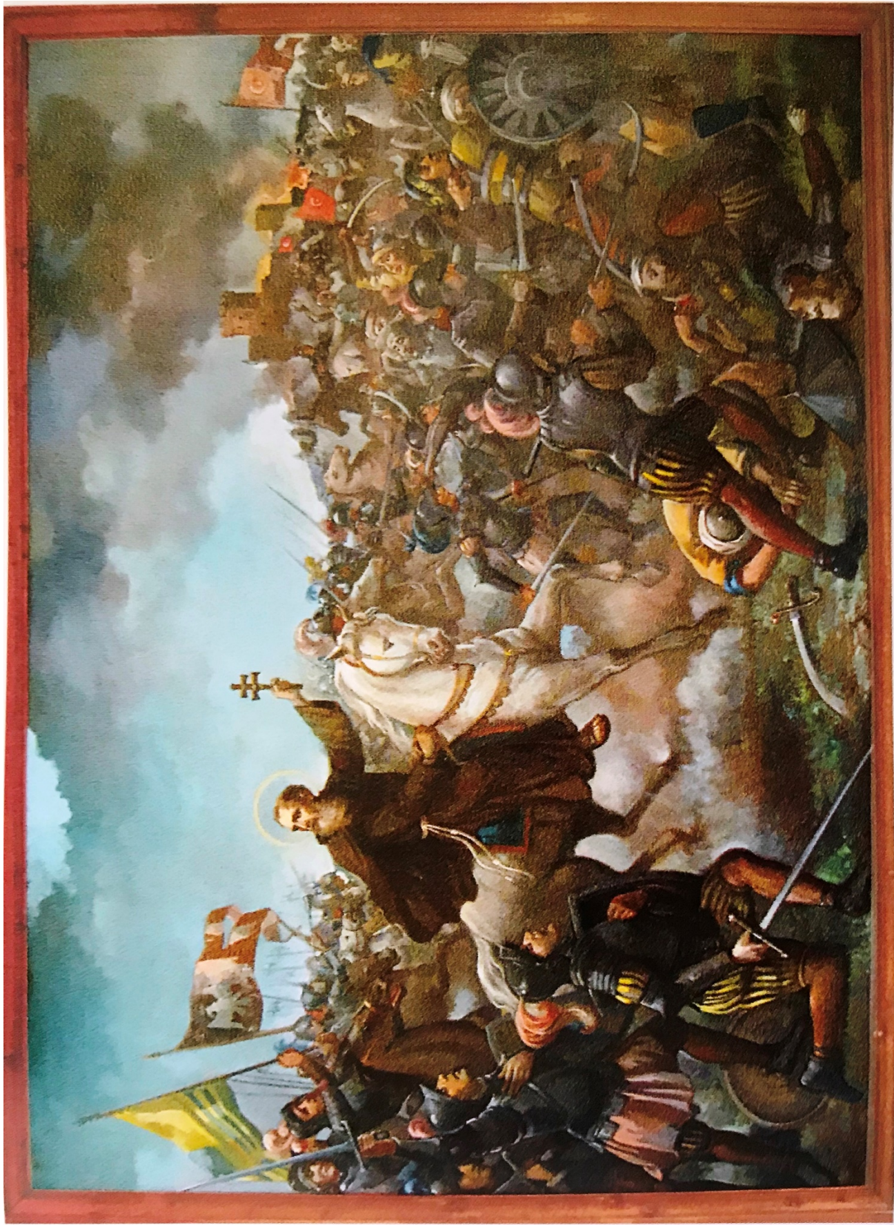
San Lorenzo da Brindisi nella battaglia di Albareale , dipinto di Umberto Colonna, 1959. Convento dei frati minori cappuccini di Bari - S. Fara.