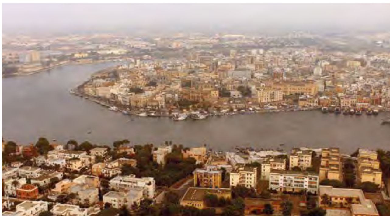
Fig. 2. Brindisi: il centro storico e i Seni di Levante e di Ponente visti da nord.

vari punti del centro storico 6 : le due Colonne romane, innanzitutto, che costituiscono il monumento più suggestivo ed emblematico di Brindisi, posto sulla propaggine più avanzata dell'altura di Ponente e affacciato sul porto; quindi i resti – purtroppo mal conservati e poco comprensibili – del portico monumentale di via Casimiro; il tratto di cinta muraria visibile lungo via P. Camassa; le vasche di raccolta idrica poste a fianco di Porta Mesagne e riferibili al castellum aquae ; parte di un quartiere abitativo e di un asse viario, felicemen-