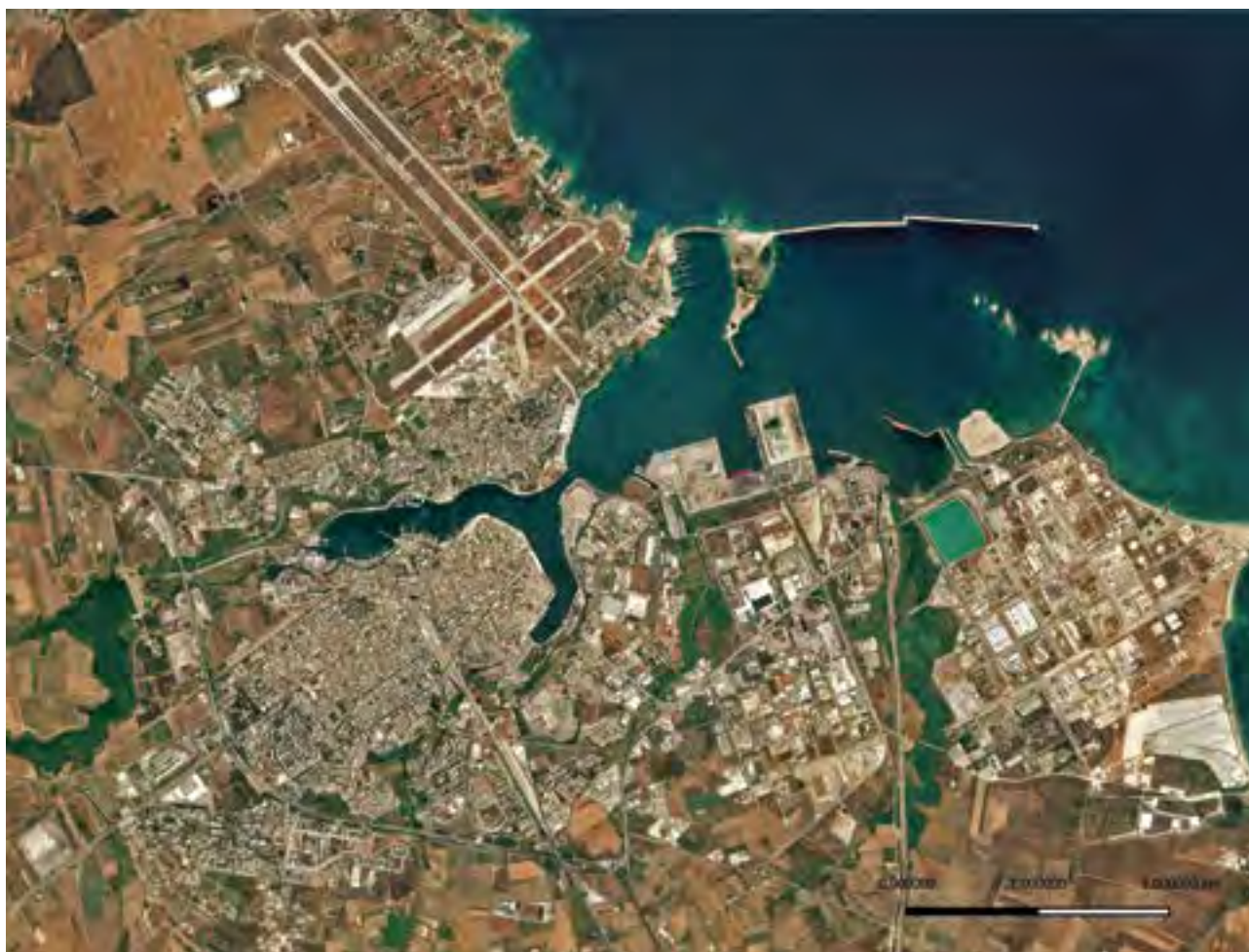
Fig. 1. Brindisi e il suo porto.

to, quindi colmato e trasformato in un asse viario in buona parte coincidente con l'attuale Corso Garibaldi. In antico presso la sua foce, all'incirca all'altezza di piazza Vittorio Emanuele, era probabilmente un'insenatura più ampia, con funzione portuale, come testimoniato dalle fonti per l'epoca medievale 5 .