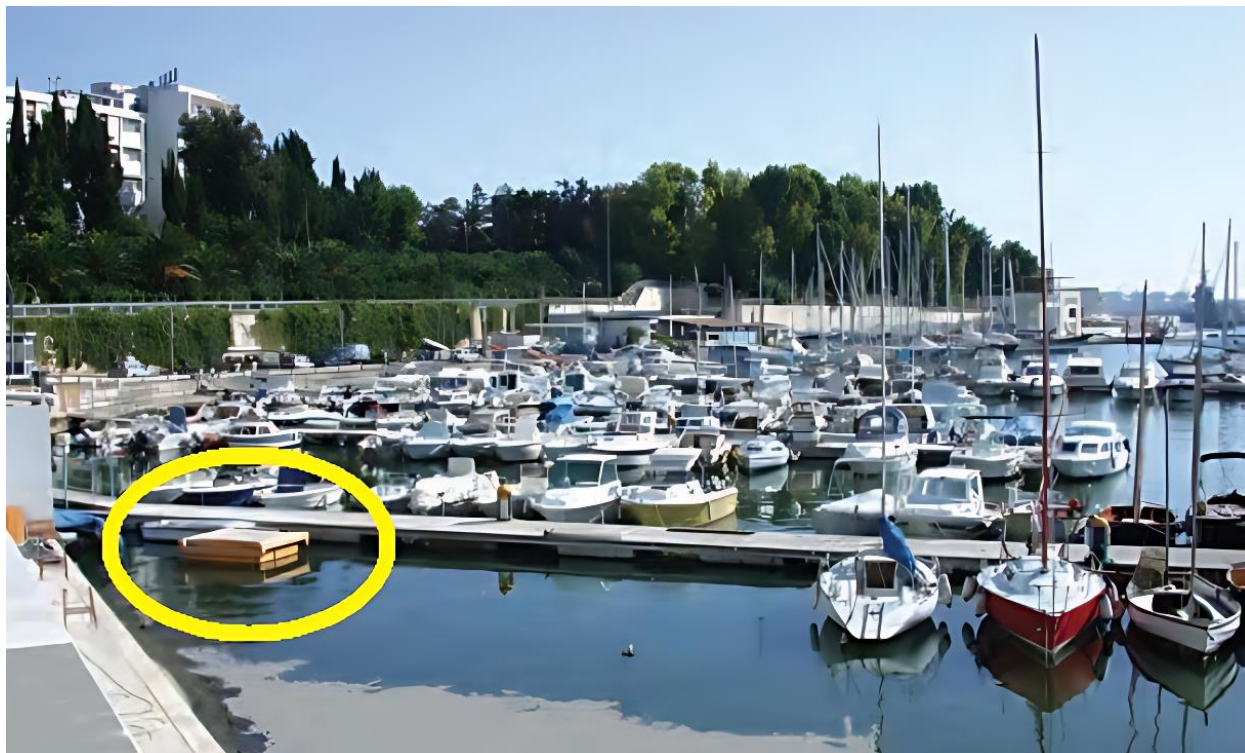
La pila sperimentale di Brindisi presso la Lega Navale di Brindisi – settembre 2004