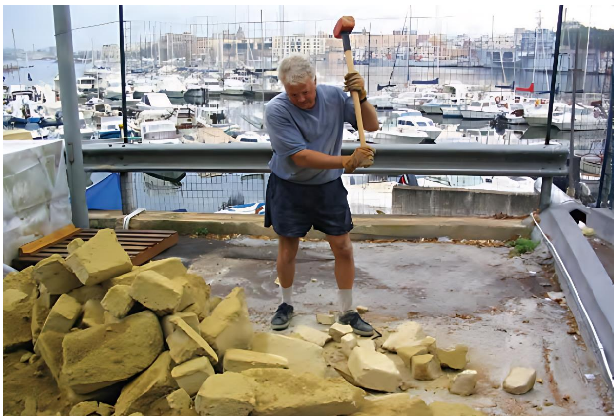
Blocchi di tufo ridotti manualmente in pietre per l'arido del calcestruzzo – Brindisi settembre 2004