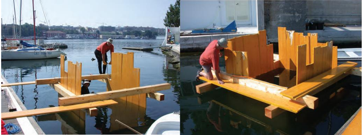
Costruzione del cassero per il getto della pila sperimentale nel porto di Brindisi – settembre 2004