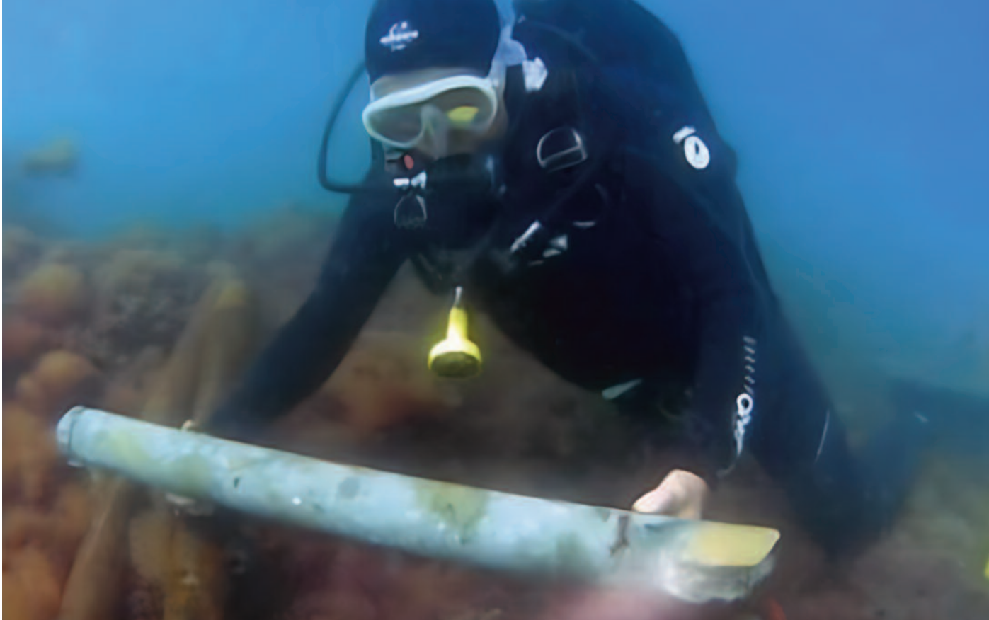
LE IMMAGINI Carota di calcestruzzo romano estratta a Egnazia il 15 maggio 2008, sotto Costruzione del cassero per il getto della pila sperimentale nel porto di Brindisi – settembre 2004

solo un po' prima, risultò “stranamente” tra le più precoci ottenute con il C14 dai vari campioni analizzati nel progetto ROMACONS, compresi quelli provenienti dal Golfo di Napoli, dove si può ragionevolmente presumere che gli antichi costruttori romani abbiano sviluppato per la prima volta un effettivo calcestruzzo marino.