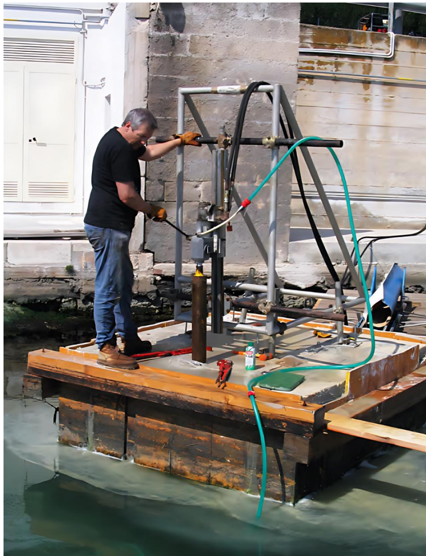
Carotaggio della pila sperimentale a Brindisi dal 2005 al 2009