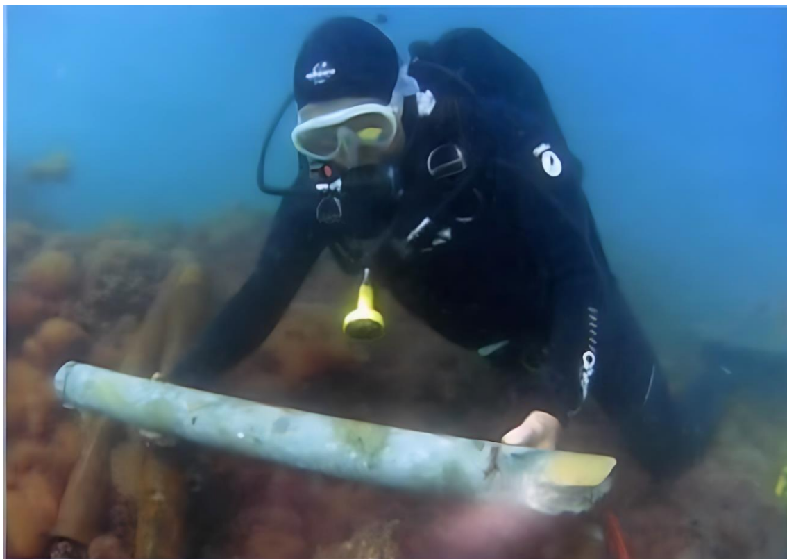
Carota di calcestruzzo romano estratta a Egnazia il 15 maggio 2008