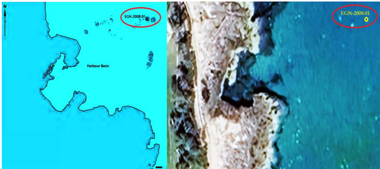
Luogo del carotaggio sottomarino - EGN 2008.01 – effettuato a Egnazia il 15 maggio 2008

Naturalmente, dopo la conclusione del progetto ROMACONS e la conseguente pubblicazione nel 2014 dell'interessantissimo testo con i suoi risultati e le sue conclusioni, negli ultimi dieci anni le ricerche su questo affascinante tema storico ingegneristico sono proseguite, sia da parte degli stessi studiosi del ROMACONS che da parte di altri ricercatori scientifici, però il progetto ROMACONS costituirà per sempre una pietra miliare e con quello, anche Brindisi resterà testimone, ancora una volta e a pieno titolo, negli annali della storia e della cultura romana.