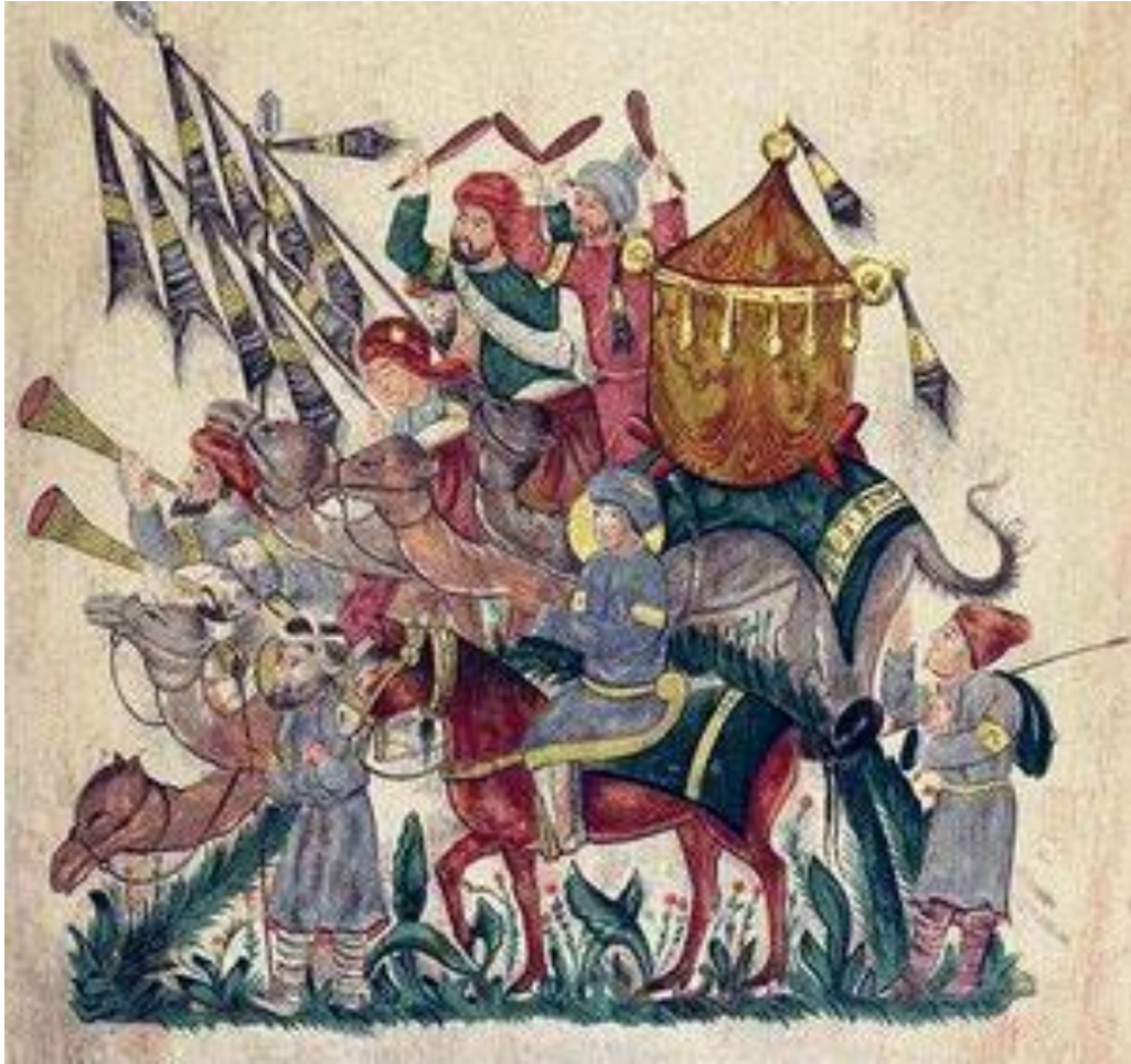
Esercito saraceno in marcia