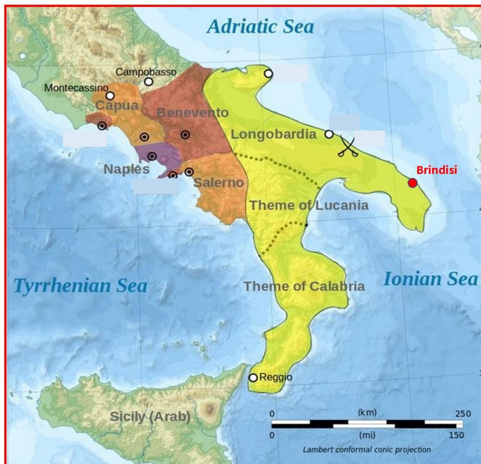
Il Meridione d'Italia intorno all'anno 1000: in disputa tra Longobardi, Bizantini e Arabi

http://www.fondazioneterradotrantanto.it/2019/06/05/brindisi-tra-ix-e-x-secolo-in-balia-del-tutti-contro-tutti-parte-seconda/