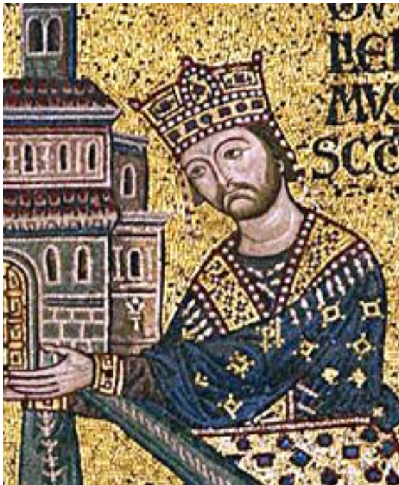
Re Guglielmo II di Sicilia "il buono"