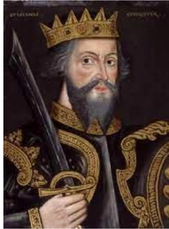
Re Guglielmo I di Sicilia "il malo"