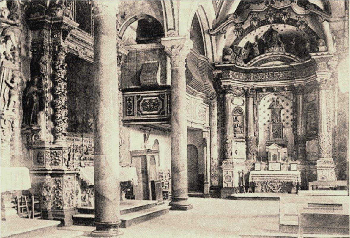
Chiesa e Chostro di San Benedetto