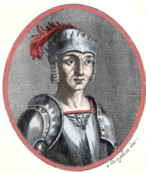
Re Tancredi - Ultimo re normanno di Sicilia