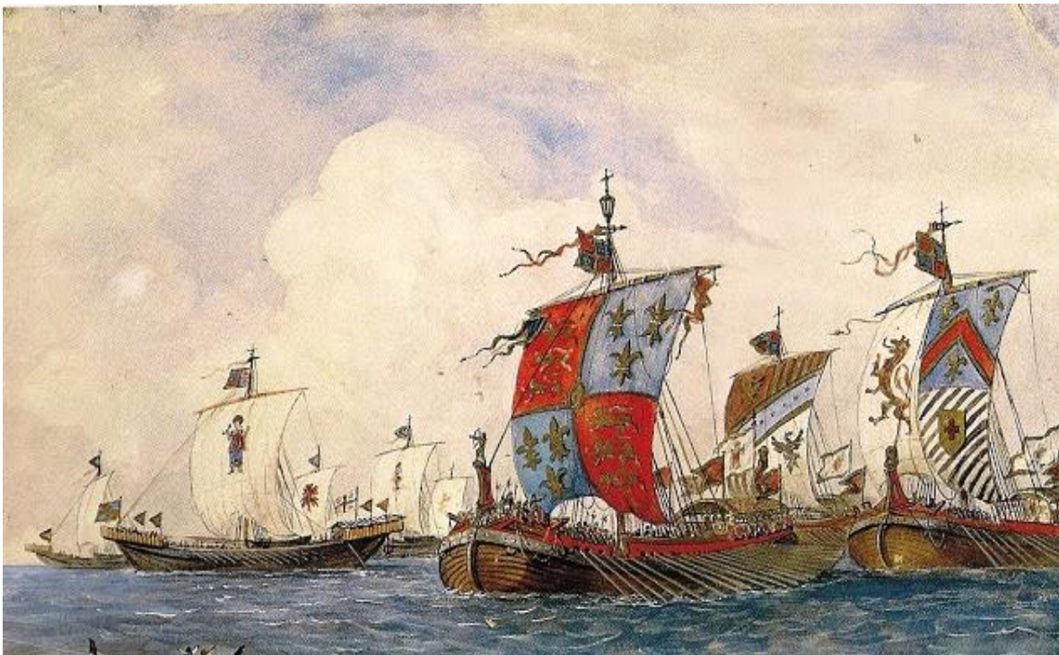
Le galee della flotta normanna dell'ammiraglio Margarite da Brindisi