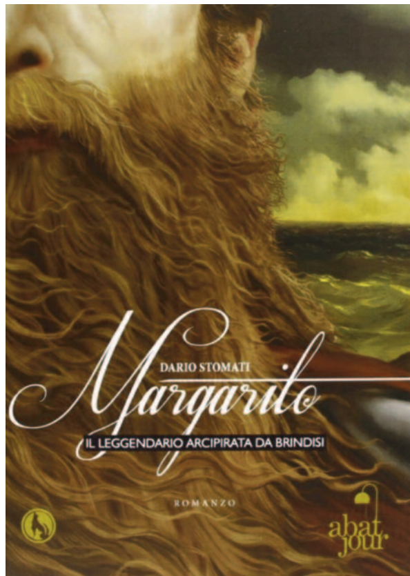
LE IMMAGINI A sinistra Margaritone di Brindisi - Biografia degli uomini illustri del Regno di Napoli ornata dei loro rispettivi ritratti compilato da diversi letterati nazionali - Tomo VII Napoli, 1820 Presso Niccola Gervasi. Qui sopra Margarito il leggendario arcipirata da Brindisi - di Dario Stomati

Ma la vera prima grande impresa militare di successo Margarito la realizzò nell'estate del 1186 sulle coste di Cipro, quando s'impadronì rocambolescamente di tutte le settanta triremi co-