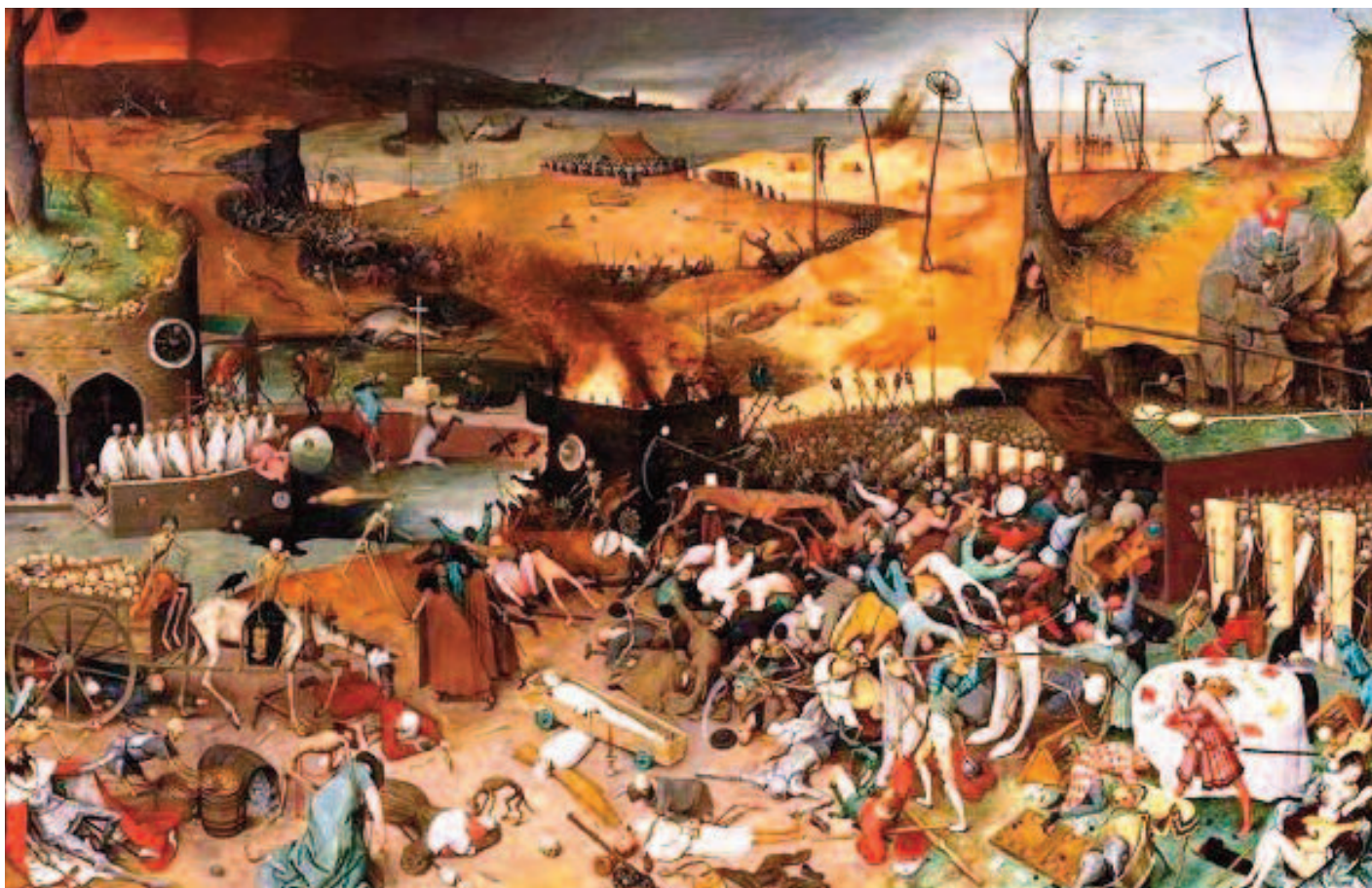
Il trionfo della morte di Pieter Bruegel-1563-Museo del Prado di Madrid

estive. E prima ancora, dopo l'arrivo di Giovanna I d'Angiò nel 1343 sul trono di Napoli, alla carestia del 1345 e alla desolazione delle cruento lotte cittadine tra i potentati familiari dei Cavallerio e dei Ripa, che nel 1346 si trasformarono in aperta guerra civile, nel 1348 si unì la terribile pandemia della peste nera europea – in cui morì anche l'arcivescovo Gallardo – che ridusse alla miseria totale l'intera città.