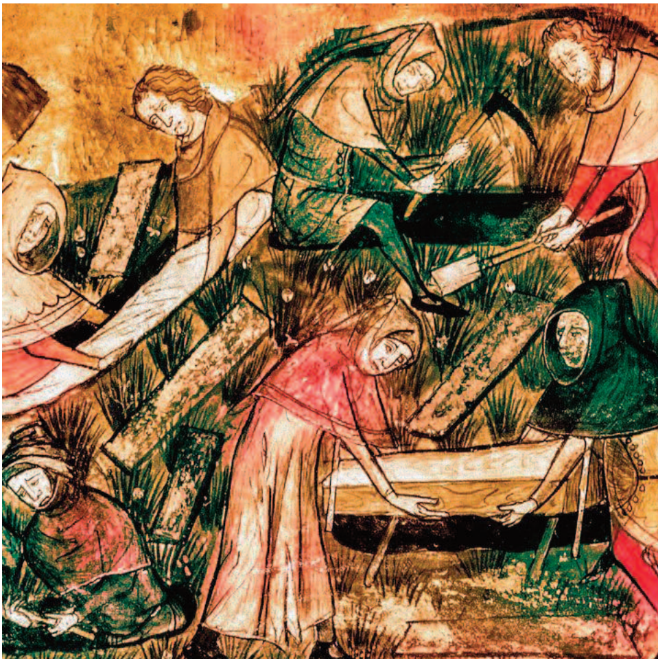
Miniatura del XIV secolo. Sepoltura delle vittime della Peste Nera. Sotto Federico II e Gregorio IX

«... mese di giugno, provenendo – via mare con i marinai della nave genovese Maria della Misericordia – dalla città di Messina che ne era stata abbondantemente colpita.»