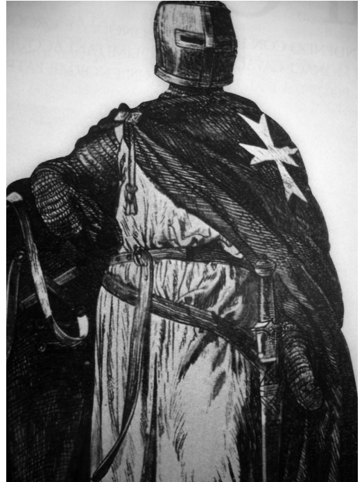
Fig. 1. Canonico Regolare del S.Sepolcro (dis. dell'A.)