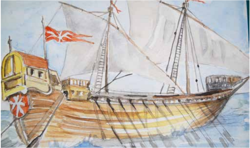
Galea del XIV sec. (dis. dell'A.)