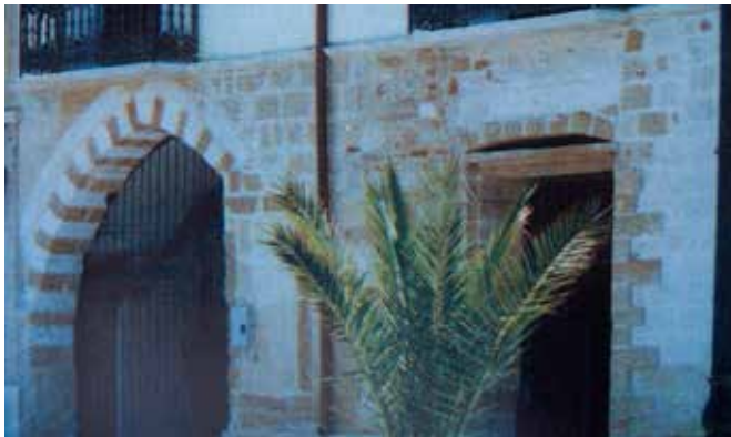
Arco del comprensorio dell'antica S. Giovanni prope litus maris

Del resto per dirla con Fedro: Successus improborum plures allicit ossia la fortuna dei malvagi è una brutta seduzione per molti.