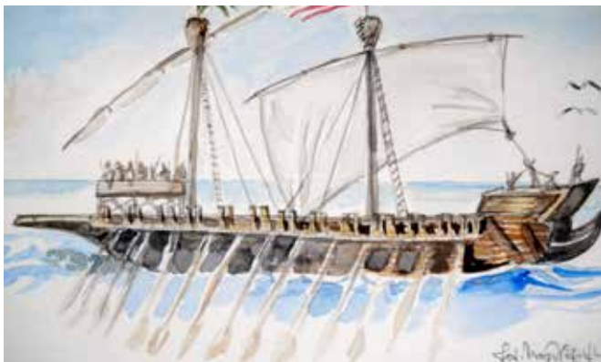
Tarida usciera (dis. dell'A.)