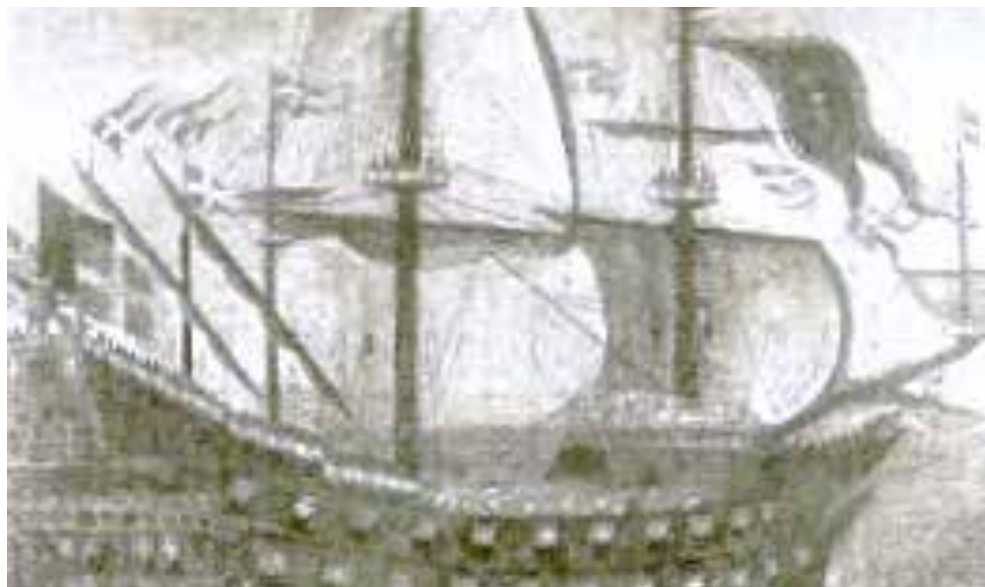
Caracca S. Anna (da incisione del XVII sec.)