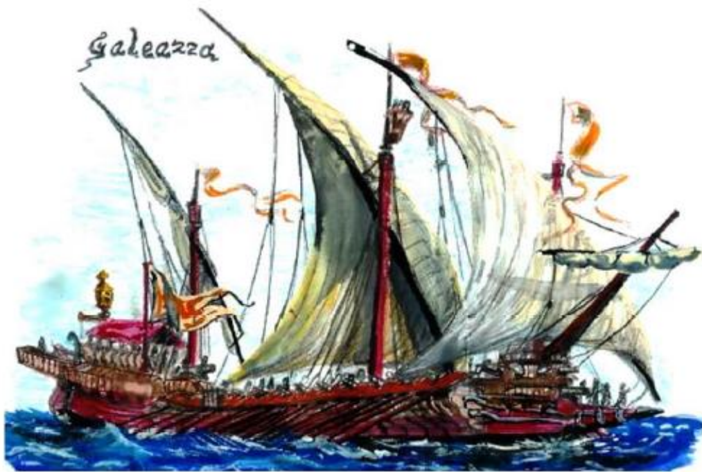
Galeazza veneziana del XVI secolo