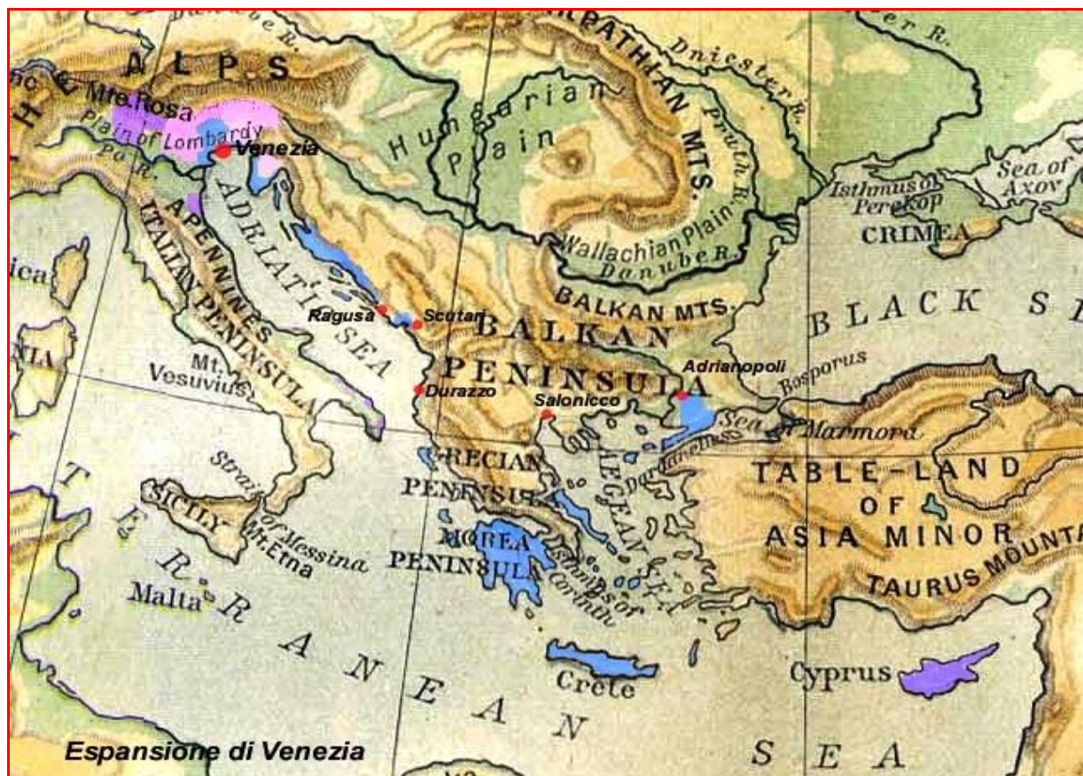
Espansione massima di Venezia - Sec. XVI