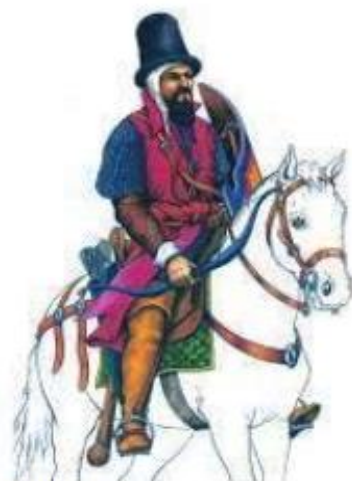
Gli Srtadioti al servizio di Venezia