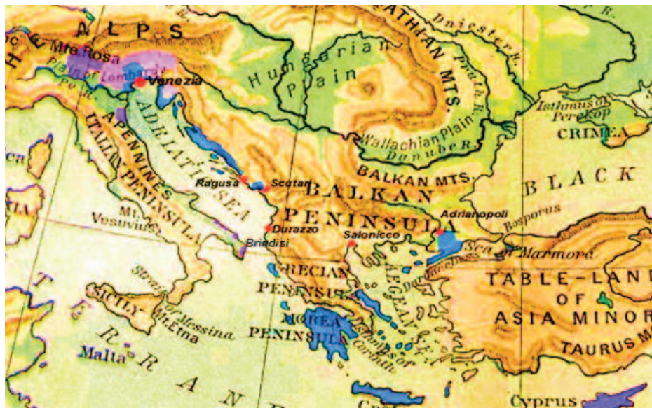
L'espansione massima di Venezia nel XVI secolo

L'11 novembre del 1500 si stipulò un accordo, tra il re di Spagna Ferdinando il Cattolico e il re di Francia Luigi XII, per spartirsi il regno aragonese di Napoli e l'accordo, nel 1504, sfociò in guerra aperta tra i due paesi alla fine della quale gli Spagnoli ebbero la meglio e Ferdinando il Cattolico divenne il nuovo sovrano di Napoli. Venezia rimase neutrale in quella guerra