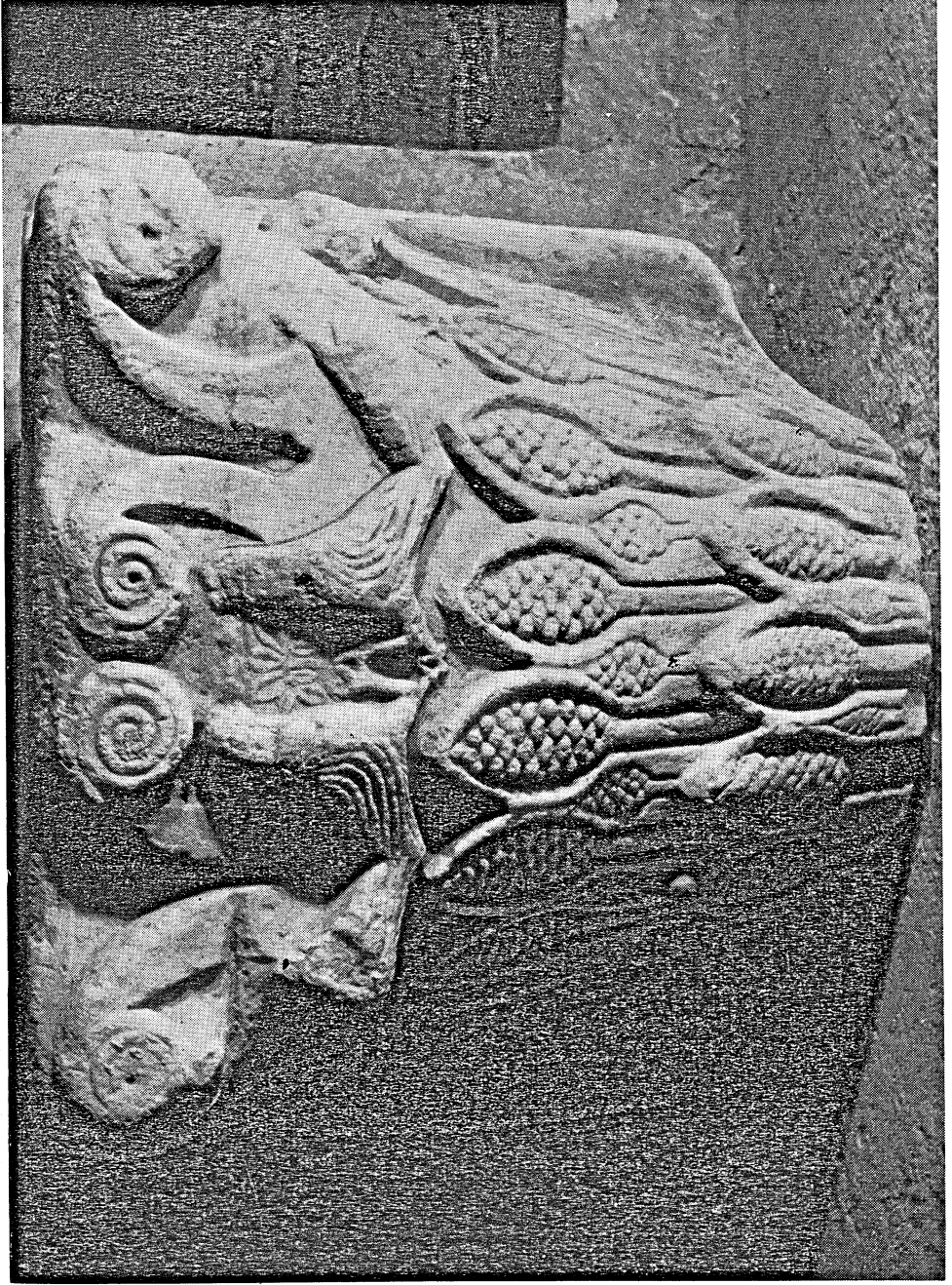
Fig. 2 - Brindisi: Museo Provinciale. Capitello proveniente dall'Abbazia di S. Andrea all'isola.