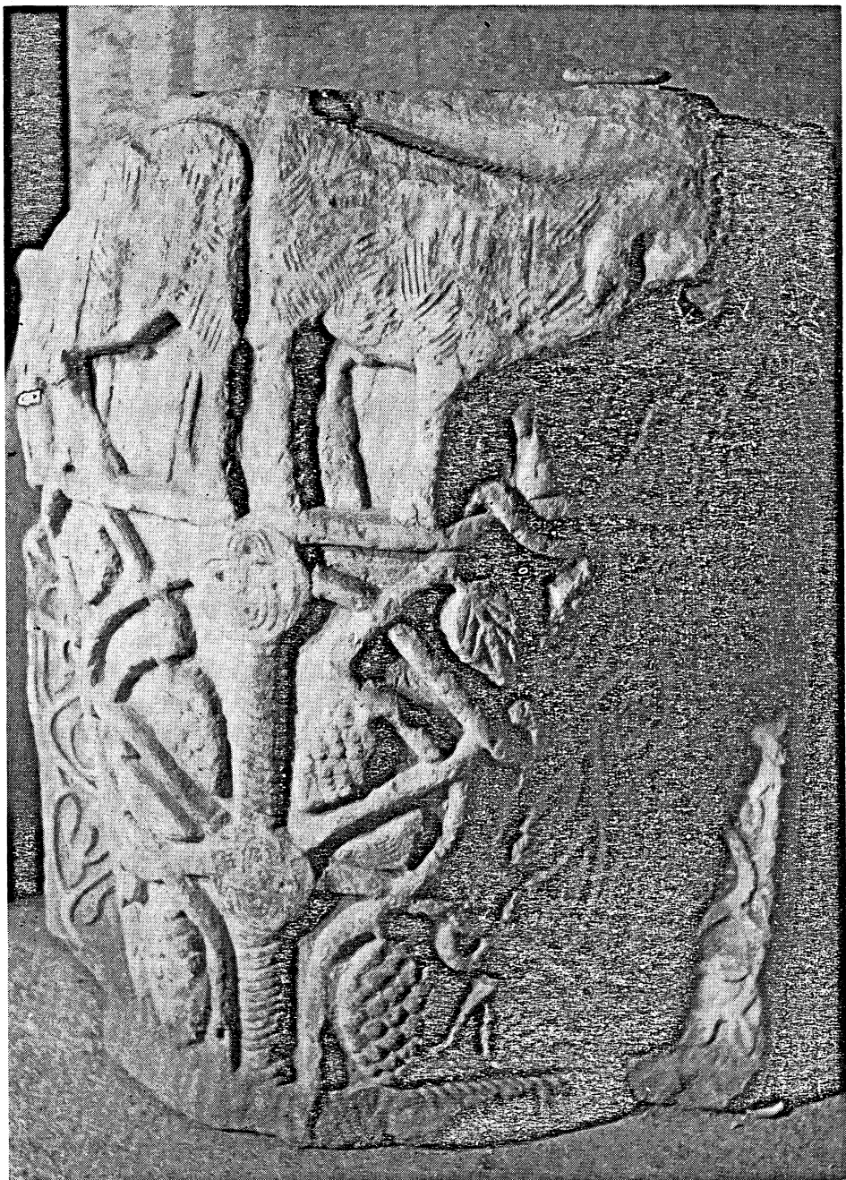
FIG. 3 - Brindisi: Museo Provinciale. Capitello proveniente dall'Abbazia di S. Andrea all'isola.