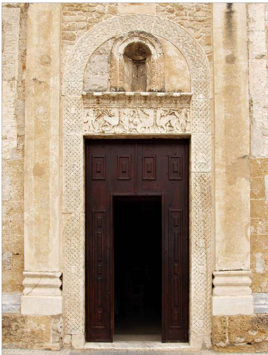
fig. 3 – Brindisi. Chiesa di San Benedetto. Portale meridionale.

sponde del Mediterraneo. Al 1005 risale, infatti, la riconquista da parte delle armate di Basilio II (976-1025) del dirimpettaio porto di Durazzo e della via Egnazia, che garantivano il transito verso Bisanzio. Il porto di Brindisi, dunque, riacquistò – come ribadito da Vera von Falkenhausen – la sua antica centralità solo in seguito a questa data. 16