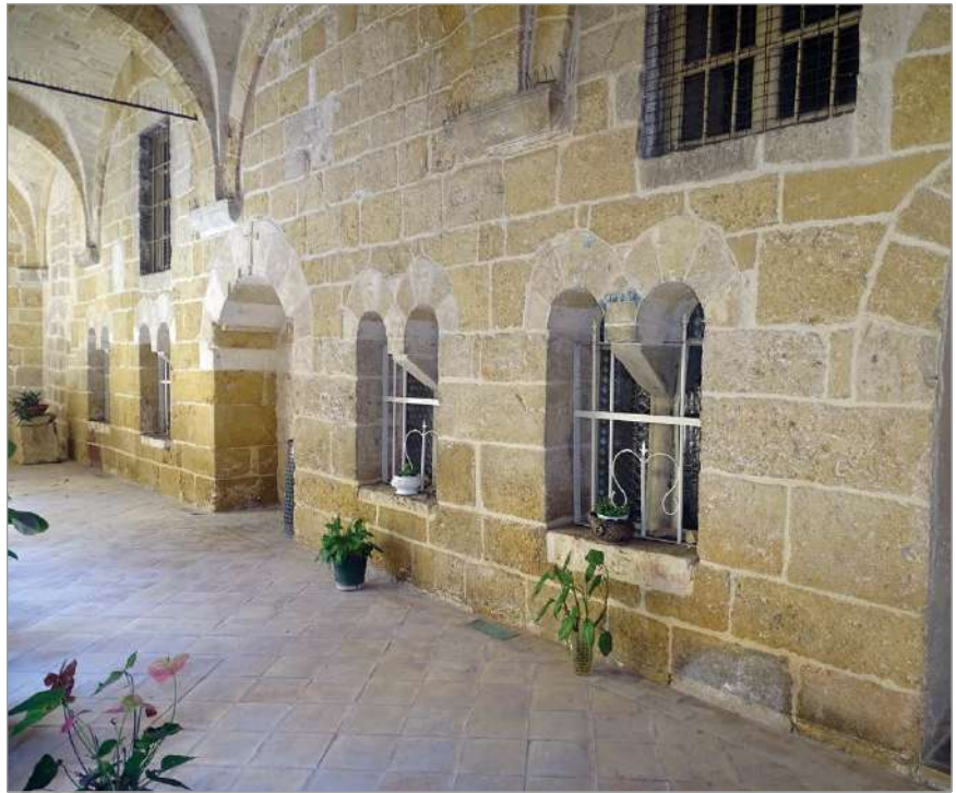
fig. 2 – Brindisi. Chiesa di San Benedetto. Chiostro, facciata dell'antico palazzo abbaziale.

un centro della loro attività di conquistatori ed il punto di congiunzione tra Costantinopoli e la loro sede». 10