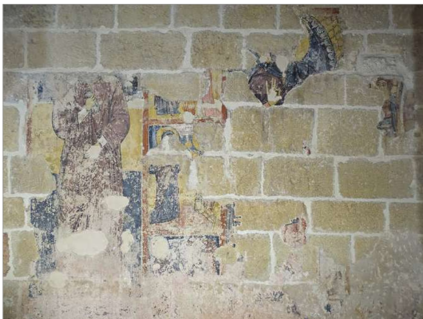
fig. 6 – Brindisi. Chiesa di San Benedetto. Chiostro, lacerti di affresco.

Valentino Pace – nella cattedrale di Aversa per poi diffondersi in Campania e, al seguito dei conquistatori normanni, in Puglia. 21 Le protomi animali ostentano, difatti, linee spigolose, pur tuttavia connotate da una marcata resa espressiva, che traspare dai denti seghettati, dagli occhi fissi di tipo globulare e dalle ali a nastro con squamette adunche (figg. 4-5).