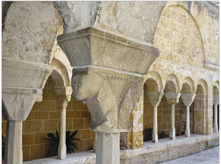
fig. 4 – Brindisi. Chiesa di San Benedetto. Chiostro, capitello zoomorfo.