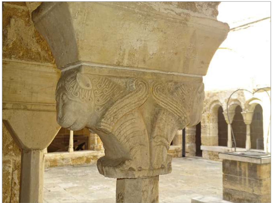
fig. 5 – Brindisi. Chiesa di San Benedetto. Chiostro, capitello zoomorfo.

di motivi vegetali e zoomorfi (fig. 3). 19 I restanti capitelli hanno semplici volumi squadrati e levigati che esaltano la preziosità del marmo. 20