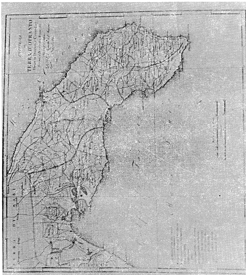
La Terra d'Otranto nell'atlante di Gennaro Bartoli.