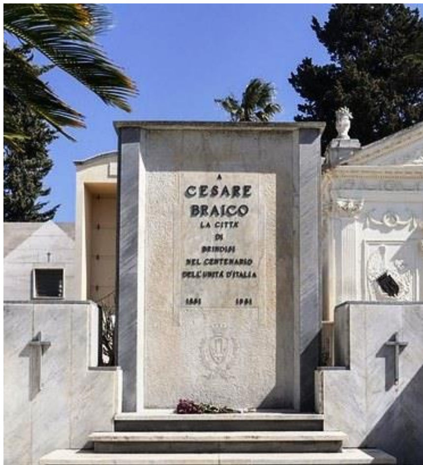
Tomba di Cesare Braico nel cimitero di Brindisi