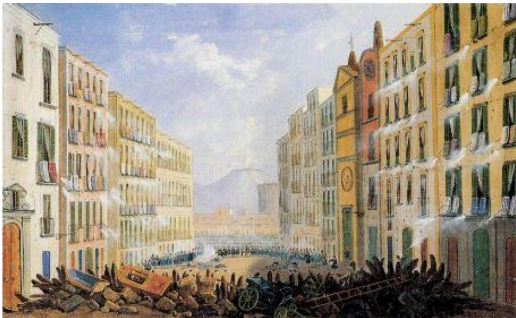
Le barricate in via Santa Brigida a Napoli il 15 maggio 1848

In quel frangente storico di metà '800, quindi, furono varie decine i brindisini che pagarono molto pesantemente – alcuni di loro con la vita – la loro decisa adesione agli ideali della libertà e della giustizia e alla lotta contro l’oppressione e l’ingiustizia. Tutti loro coraggiosi brindisini che, seguendo da vicino quei loro concittadini che solo mezzo secolo prima avevano iniziato quella stessa battaglia contro quello stesso nemico, dovevano ben presto – molti di loro – presenziare quella che nel 1861 sembrò essere stata la vittoria. Purtroppo, però, si trattò di una vittoria molto dubbia, forse finanche pirrica e, comunque, non certo risolutiva.