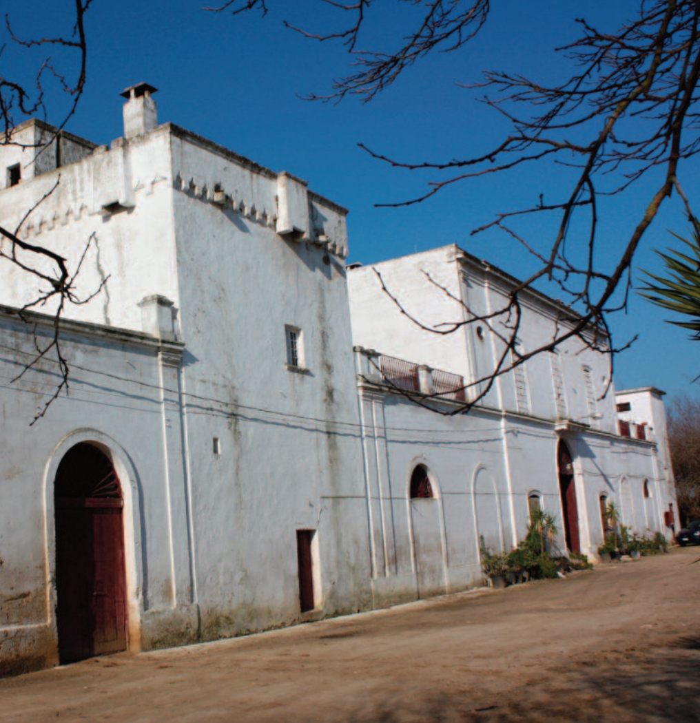
Sopra masseria Masina, una di quelle prese d'assalto nell'Ottocento. A sinistra una banda di briganti meridionali, in basso a destra un dipinto che raffigura un assalto di briganti

politico, “iniziato in forma organica e sistematica con episodi di violenza, sequestri di persone, ricatti, uccisioni e invasioni al grido ‘Viva Francesco Secondo! Abbasso Vittorio Emanuele!’”, episodi posti in essere da un nucleo iniziale assai ridotto di uomini, via via ingrossandosi sino a superare le duecento unità, armate e a cavallo”.