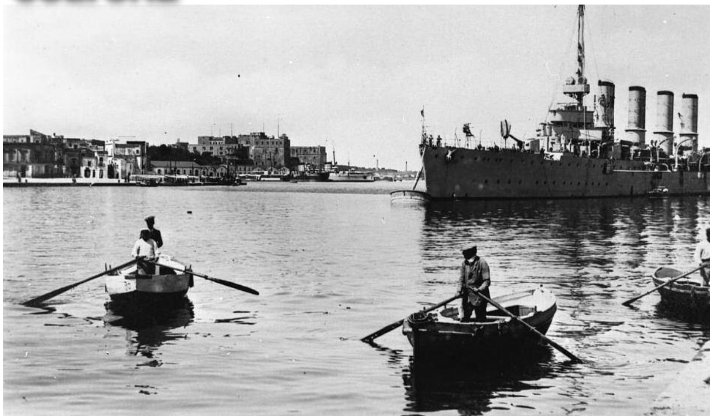
LE IMMAGINI Una nave militare nel porto di Brindisi, in basso ancora un'immagine di Paolo Thaon di Revel

torio Emanuele III e l'imperatore di Prussia e Germania Guglielmo II, nazione a noi coalizzata insieme all'Austria-Ungheria, un incontro organizzato due giorni prima proprio a bordo della moderna corazzata, per confrontarsi e curare gli ormai precari equilibri politici tra gli imperi alleati (l'episodio è stato raccontato sul n. 147 del nostro settimanale). I sovrani tedeschi e italiani partirono lo stesso giorno rispettivamente per Vienna e Roma, mentre la real nave ed il suo dinamico comandante rimasero nella rada di Brindisi per preparare quello straordinario ingresso nel porto interno, utile a dissipare ogni dubbio sulla possibilità di ospitare sui moli interni non solo il naviglio leggero e le siluranti, ma anche i "legni di notevole tonnellaggio". La notizia, ovviamente, non passò inosservata, ma ebbe ripercussioni ben più vaste soprattutto all'estero, dove venne da subito compresa l'importanza di quanto dimostrato da Thaon di Revel, ovvero che l'Italia aveva ritrovato una determinante base per i traffici commerciali, ma soprattutto come la Marina italiana avesse di colpo acquisito un nuovo formidabile e funzionale scalo militare, pronto per eventuali scopi bellici.