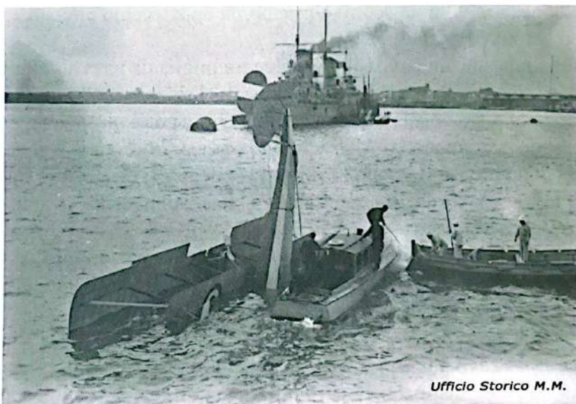
Idrovolante italiano capovoltosi viene preso a rimorchio. Brindisi, 1918?

21 ottobre - Sei idrovolanti di Brindisi eseguono una esplorazione aerea su Cattaro.