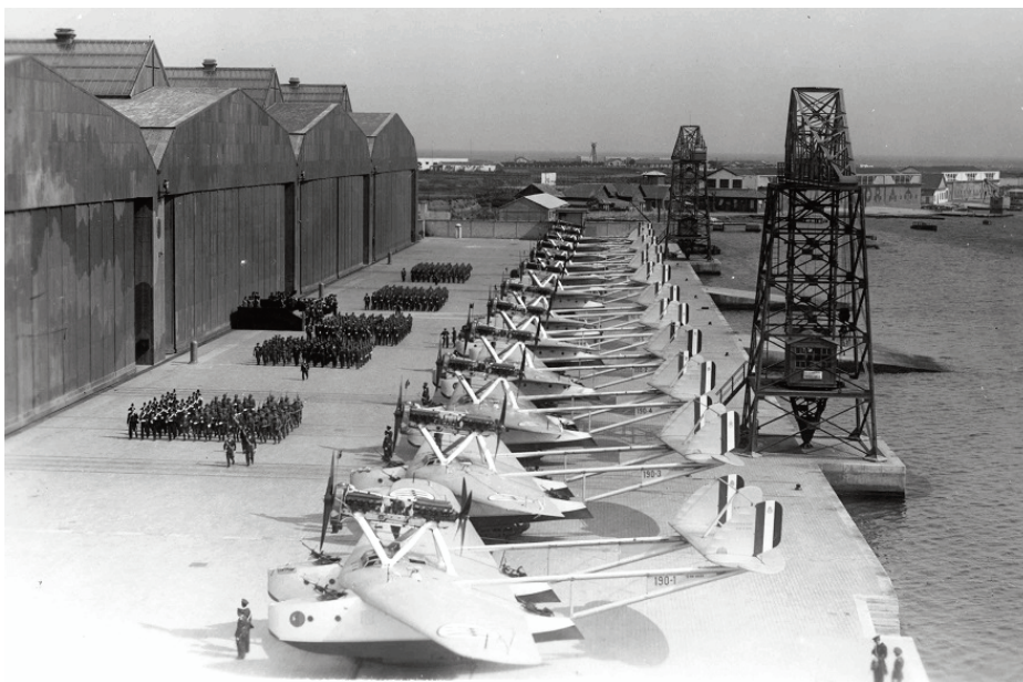
L'idroscalo presso l'Aeroporto di Brindisi