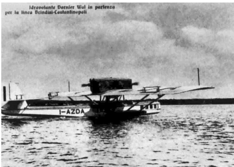
Idrovolante Dornier Wal in partenza per la linea Brindisi-Costantinopoli

Con il secondo conflitto mondiale l'attività civile fu soppressa, l'ultimo idrovolante di linea partì da Brindisi per Ancona il 9 settembre del 1943. Solo gli idrovolanti militari ripresero a volare nel secondo dopoguerra, completando la loro opera prima della fine degli anni '60.