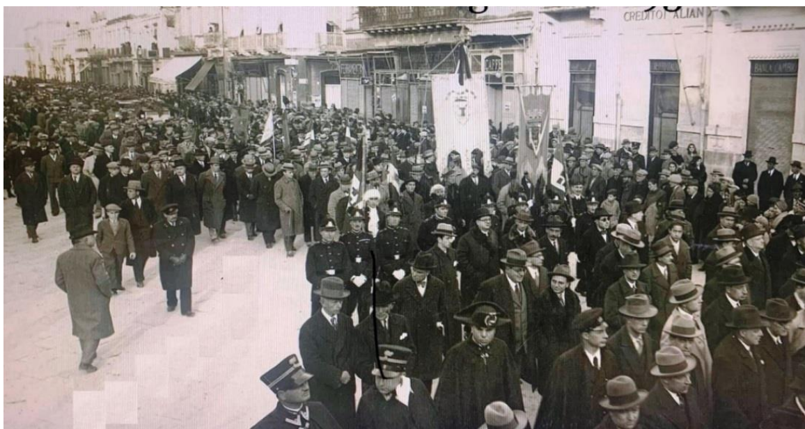
Uno scorcio del funerale di Angelo Titi a Brindisi il 23 febbraio del 1932