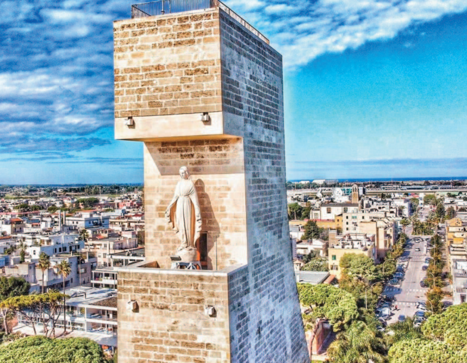
LE IMMAGINI Tre spettacolari immagini aeree della statua della Madonna collocata nel dente del timone