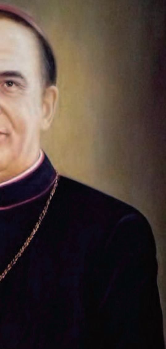
Un ritratto di monsignor Settimio Todisco a in basso un busto che raffigura San Leucio

tassi, che nel 1098, obbedendo alle reiterate intimazioni del papa Urbano II, finalmente riportò – dopo quattro secoli – la sede episcopale a Brindisi, dov'è rimasta ininterrottamente fino ad oggi, con Caliendo arcivescovo numero 102 della cronotassi.