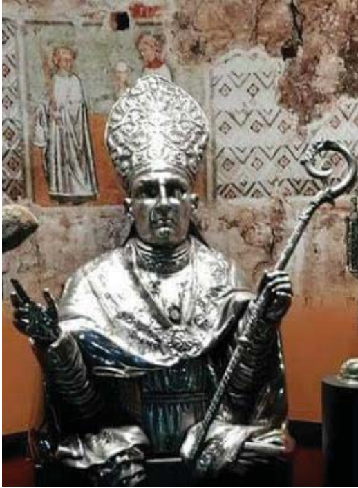
San Leucio è stato il primo vescovo di Brindisi