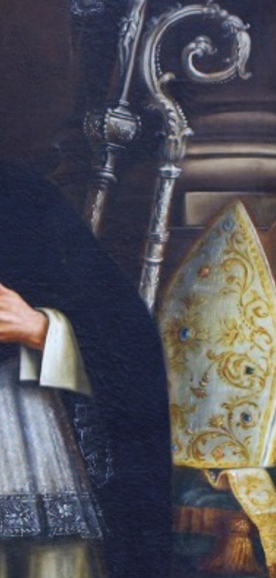
Un ritratto di Alberto Mara Capobianco, brindisino che fu arcivescovo di Reggio Calabria, sotto Giuseppe Satriano, attuale arcivescovo di Rossano Calabro

vicario generale per quella diocesi, mentre egli non vi si recò mai perché occupato ad assolvere l'incarico di 'Inquisitore di Malta'. In Nardò Granafei rimase fino al 9 giugno 1653, quando fu nominato vescovo di Alessano dal papa Innocenzo X, alla cui morte, nel 1655, fu elevato al trono pontificio Fabio Chigi col nome di Alessandro VI. Papa dal quale, l'11 ottobre del 1666, Giovanni Granafei fu promosso arcivescovo di Bari. Nella sua sede arcivescovile di Bari, Granafei arricchì di lampade ed arredi la cattedrale, nel 1672 ne consacrò l'altare in onore del Santissimo Sacramento e nel 1674 commissionò all'argentiere napoletano Andrea Finelli un busto argenteo di San Sabino ad arredo della sacrestia. Nel 1675, inoltre, celebrò un sinodo e l'anno seguente, a Venezia, ne pubblicò gli atti intitolati Constitutiones Dioecessanae . Durante la sua prolungata permanenza a Nardò in qualità di vicario generale della diocesi, all'arcidiacono Giovanni Granafei toccò di essere presente durante i gravissimi fatti accaduti in quella città nell'estate del 1647, nel contesto delle sommosse popolari che in varie città del regno napoletano seguirono alla rivolta degli Sciabicoti brindisini del 5 giugno ed alla più famosa rivolta di Masaniello scoppiata in Napoli il 7 luglio. Il popolo contadino di Nardò si sol-