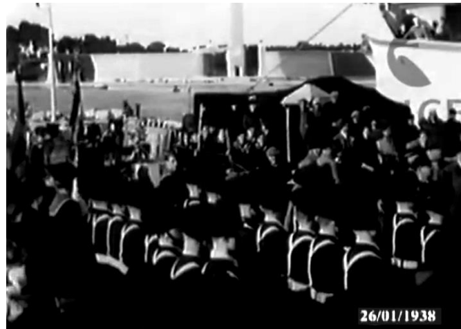
26 gennaio 1938: Partenza da Brindisi del 1° nucleo rurali dell'Ente di Colonizzazione Puglia d'Etioopia