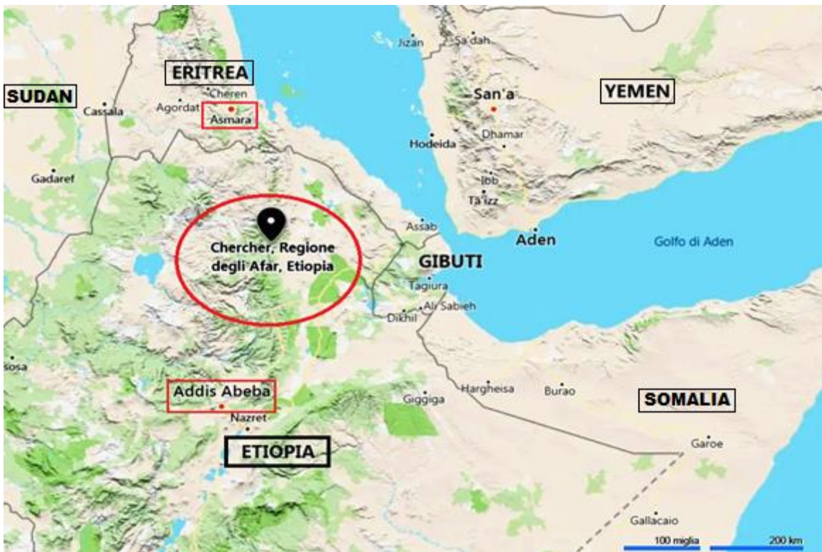
Etiopia, Regione degli Afar, Provincia del Chercher: Area dell'Ente di Colonizzazione di Puglia d'Etioopia