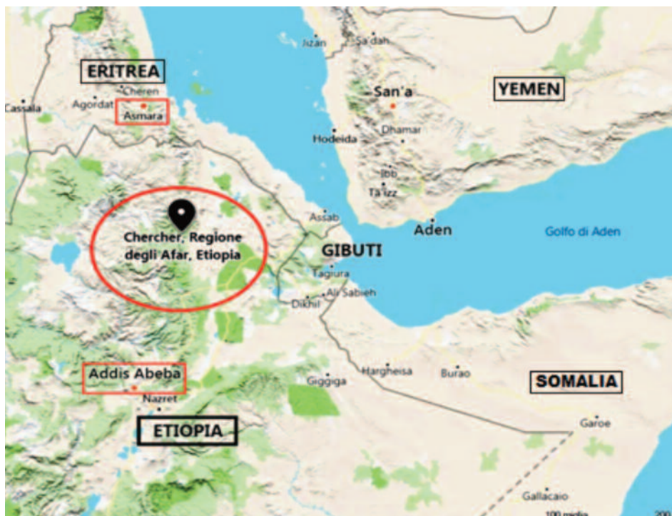
LE IMMAGINI Etiopia, Regione degli Afar, Provincia del Chercher: Area dell'Ente di Colonizzazione di Puglia d'Etiopia, sotto il piroscampo transatlantico Conte rosso - requisito al Lloyd triestino per la guerra d'Etiopia

«... Trentamila persone circa rientrarono in Patria dall'AOI tra il 1942 e il 1943: la società italiana che avevano lasciato ormai non esisteva e quella attuale che li accolse aveva valori molto diversi; loro stessi erano diversi da quando si erano allontanati dall'Italia. Il fascismo non era più la garanzia certa di una vita di lavoro, quel fascismo che, nella maggior parte dei casi, li aveva spinti a cercare fortuna in terre lontane o a migliorare comunque le proprie condizioni di vita con agi a volte per loro impensabili in Italia. Grandi delusioni, ricordi e amarezze accompagnarono ognuno di quei tanti viaggiatori: la guerra sarebbe ancora continuata, mentre l'Italia all'epilogo della sua avventura coloniale, si avviava verso l'apice della disastrosa guerra in cui s'era lanciata...» [“Il rimpatrio degli italiani dall'A.O.I.: le navi bianche” di Maria Gabriella Pasqualini, 1993] Era accaduto che agli inizi del 1941, le forze inglesi avevano intrapreso una travolgente avanzata sull'Africa Orientale Italiana e dopo il 17 maggio 1941, vinta sull'Amba Alagi l'ultima resistenza italiana, completarono l'occupazione di tutti i territori dell'AOI, imprigionando gli italiani uomini e concentrando donne vecchi e bambini in vari campi