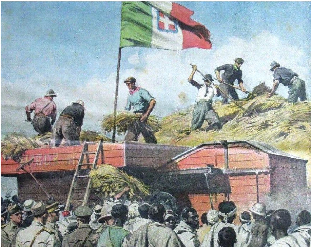
“La prima messe dell’Impero: in territorio di Oletta a 40 Km da Adis Abeba, dove i coloni hanno organizzato vaste piantagioni sperimentali, è stato festosamente trebbiato il primo grano d’Etiopia coltivato da Italiani” (Copertina della Domenica del Corriere del 16 gennaio 1938)