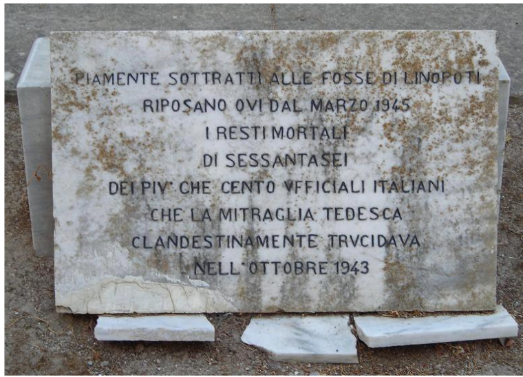
Campana della memoria e Lapide originamente posta sulla fossa comune del cimitero di Coo