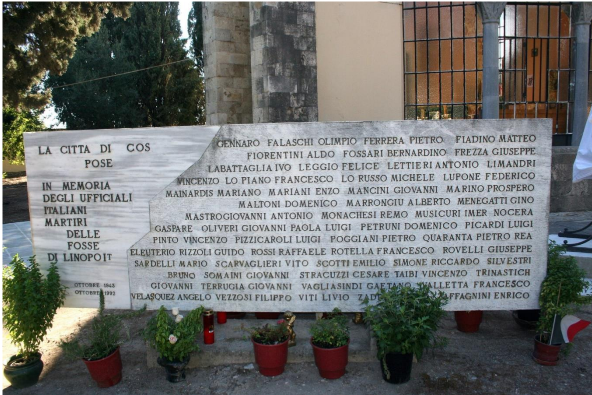
Lapide monumentale nel cimitero di Kos in memoria dei 103 ufficiali italiani trucidati